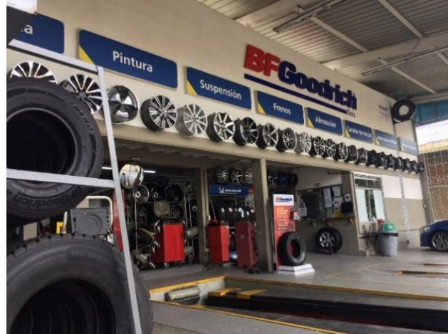
Figura 2. Área de servicios y mantenimiento, elaboración propia.

Misión: Es una empresa que comercializa marcas líderes en el mercado de llantas, rines, accesorios, pintura automotriz e industrial y complementarios, nos enfocamos en mantenimientos preventivos, correctivos y embellecimiento automotriz, impulsados con innovación sobresaliente en maquinaria de última tecnología, el mejor talento humano, e instalaciones que permiten el buen funcionamiento de los servicios con calidad y eficiencia, buscando siempre mejorar la calidad de vida y la seguridad de nuestros clientes a la hora de conducir su vehículo.