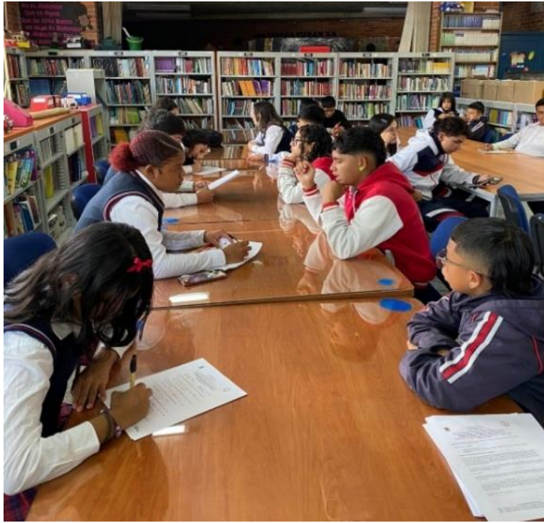
Nota. Fotografía tomada por las autoras durante el trabajo de campo en la IED San Francisco (2024).