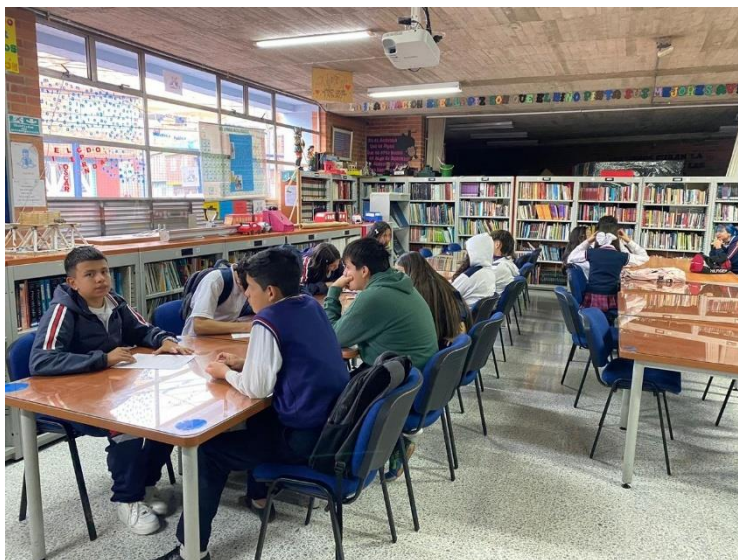
Figura 3 Estudiantes socializando propuestas de mejora en la convivencia escolar.

Nota. Fotografía tomada por el autor durante el encuentro del semillero del 6 de octubre de 2024.