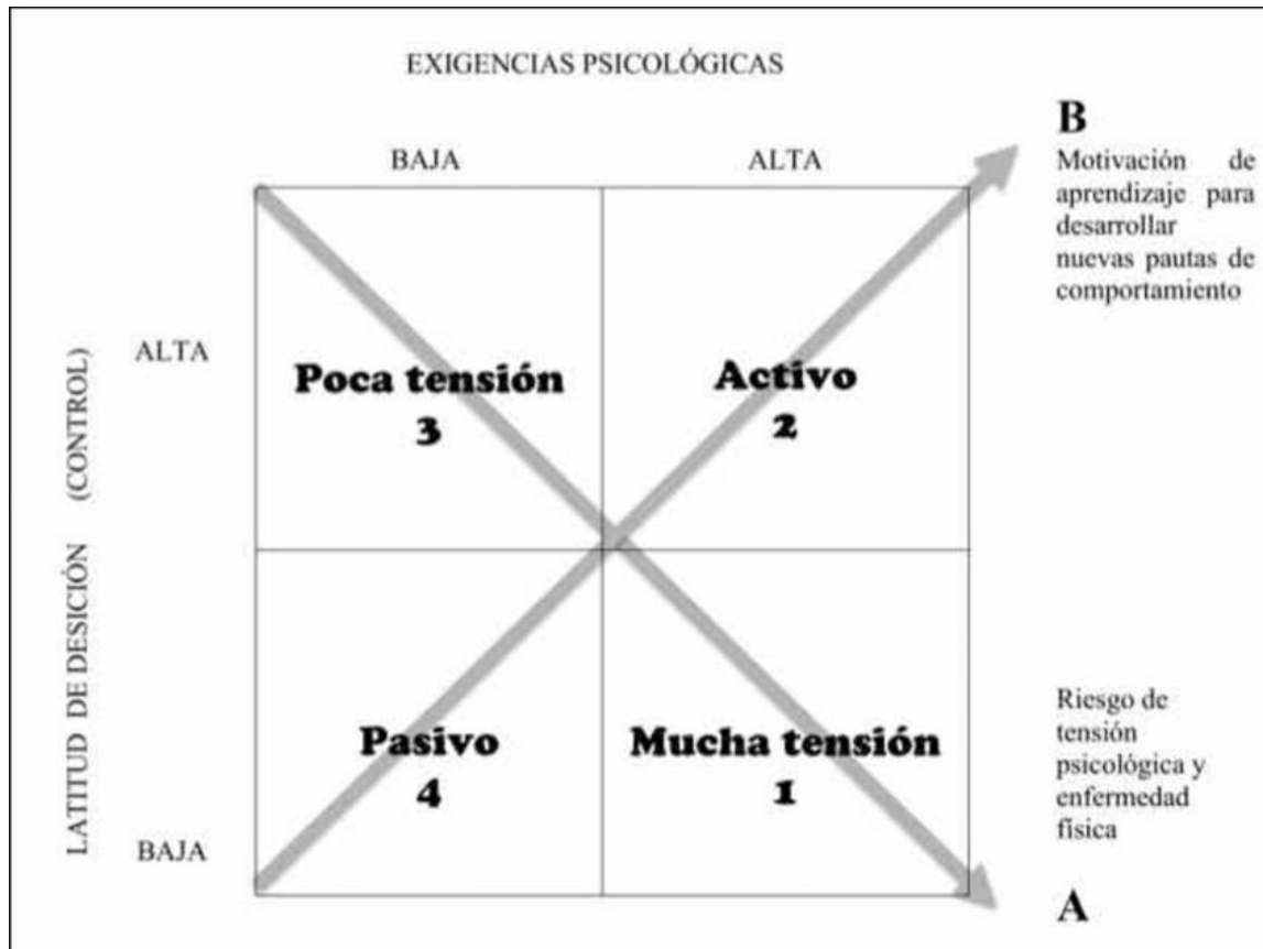
Figura 2. Modelo de demanda – control y apoyo social de Robert A. Karasek y Johnson (1979).

El análisis de los riesgos laborales en entornos digitales, especialmente aquellos que afectan la salud mental de los creadores de contenido, encuentra un marco explicativo sólido en el Modelo Demanda–Control propuesto por Robert Karasek en 1979 . Este modelo plantea que el estrés laboral no depende únicamente de la carga de trabajo, sino de la interacción entre dos dimensiones fundamentales: las demandas psicológicas y el grado de control que el trabajador tiene sobre sus tareas.