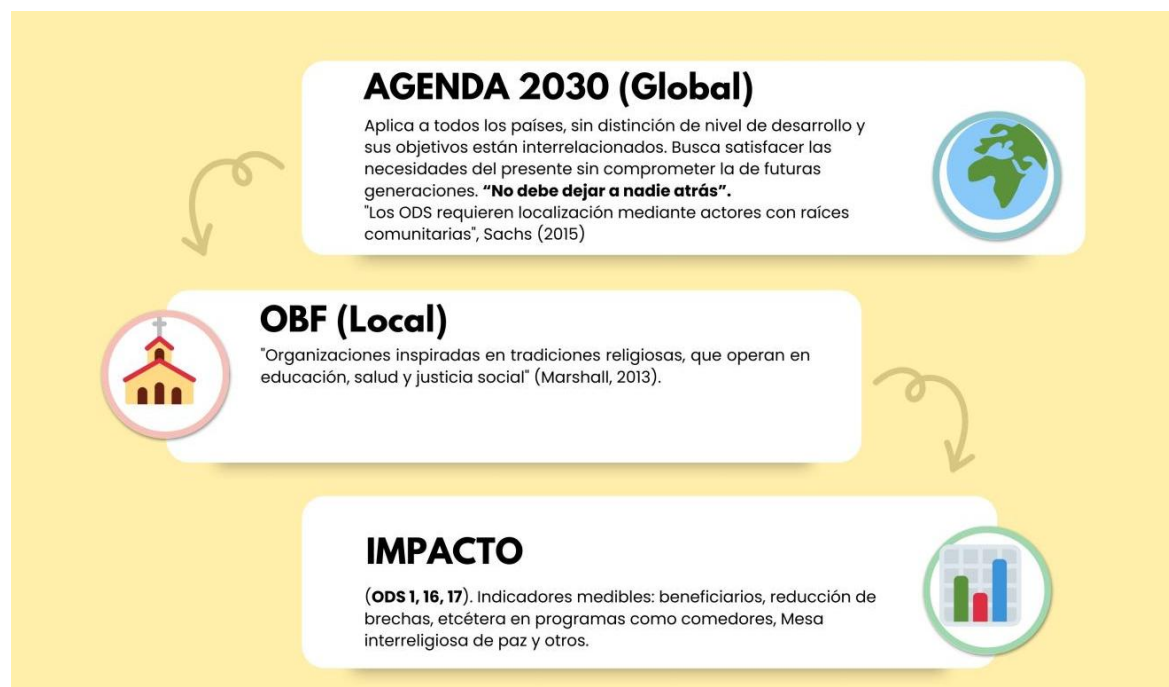
Ilustración 1. Articulación OBF – ODS