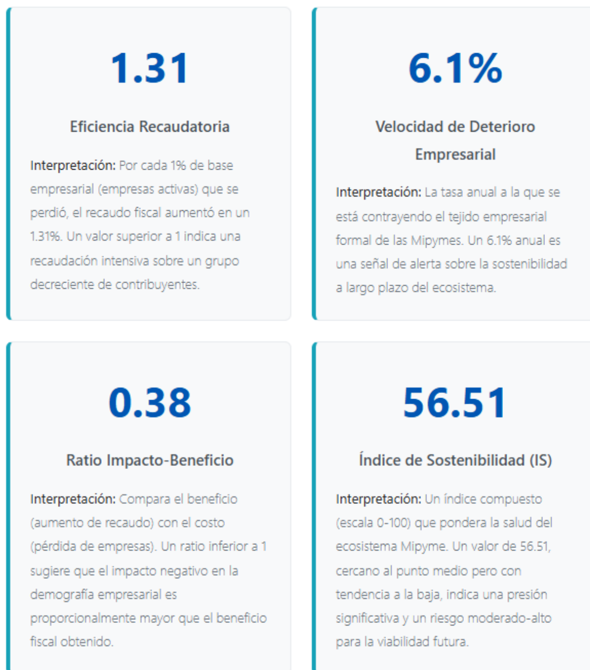
Figura 3. Tendencias de crecimiento empresarial previo y posterior a la Ley 2277 de 2022. Elaboración propia con información de Fedesarrollo (2022).

Eficiencia, velocidad, ratio y sostenibilidad en base de las Mypimes