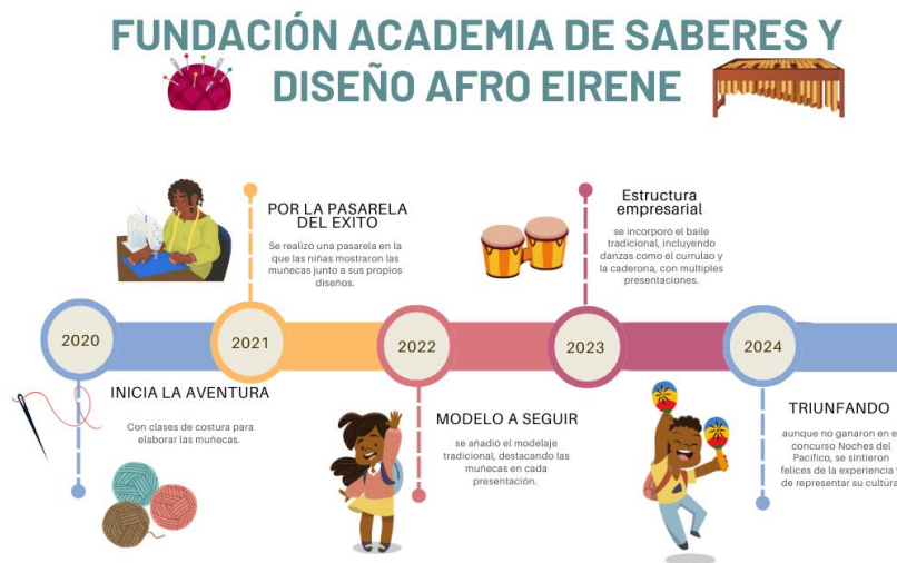
Figura 2 Línea de tiempo academia de saberes

La Fundación Academia de Saberes y Diseño Afro Eirene podemos considerarlo ya un emprendimiento social, del cual hacen parte ya al día de hoy 10 niños y jóvenes hombres y 20 niñas y jóvenes mujeres, entre las que se encuentra una persona de género diverso. Dentro de su filosofía esta la promoción de la equidad de género y la prevención de todo tipo de violencias, especialmente las violencias Basadas en Género VBG.