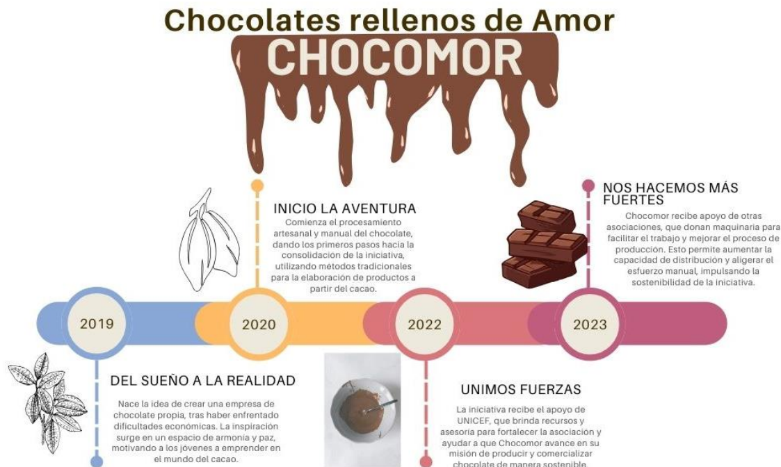
Figura 1 Línea de tiempo Chocomor