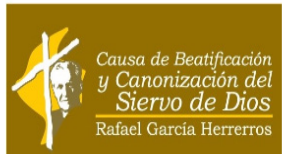
Fuente: Logo de la causa