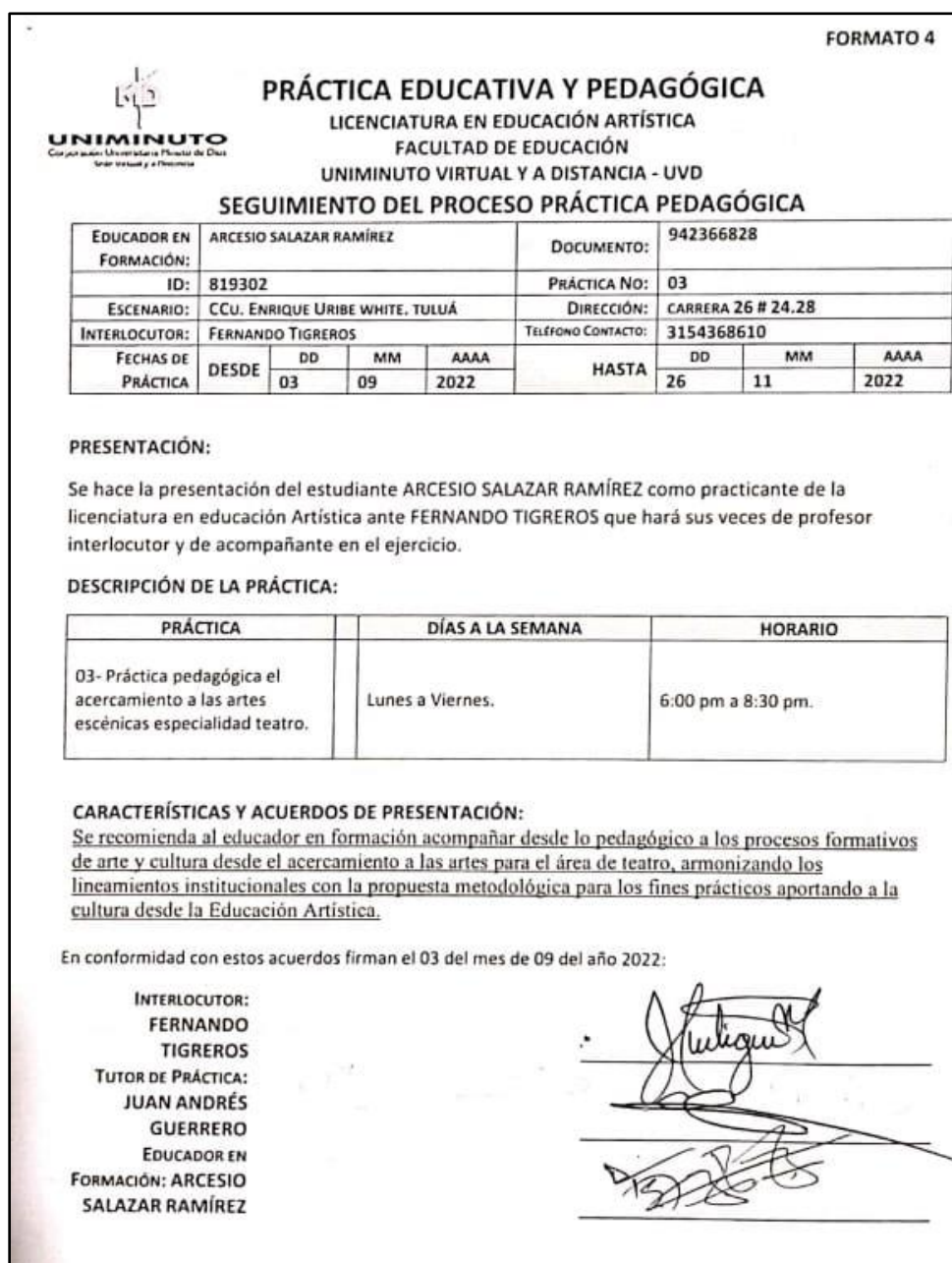
Cuadro 4, formato 4 seguimiento del proceso práctica pedagógica Uniminuto