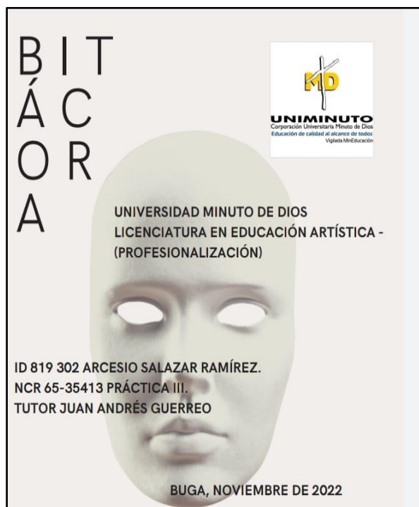
Cuadro 6, bitácora construida por el docente en formación (Fuente propia)