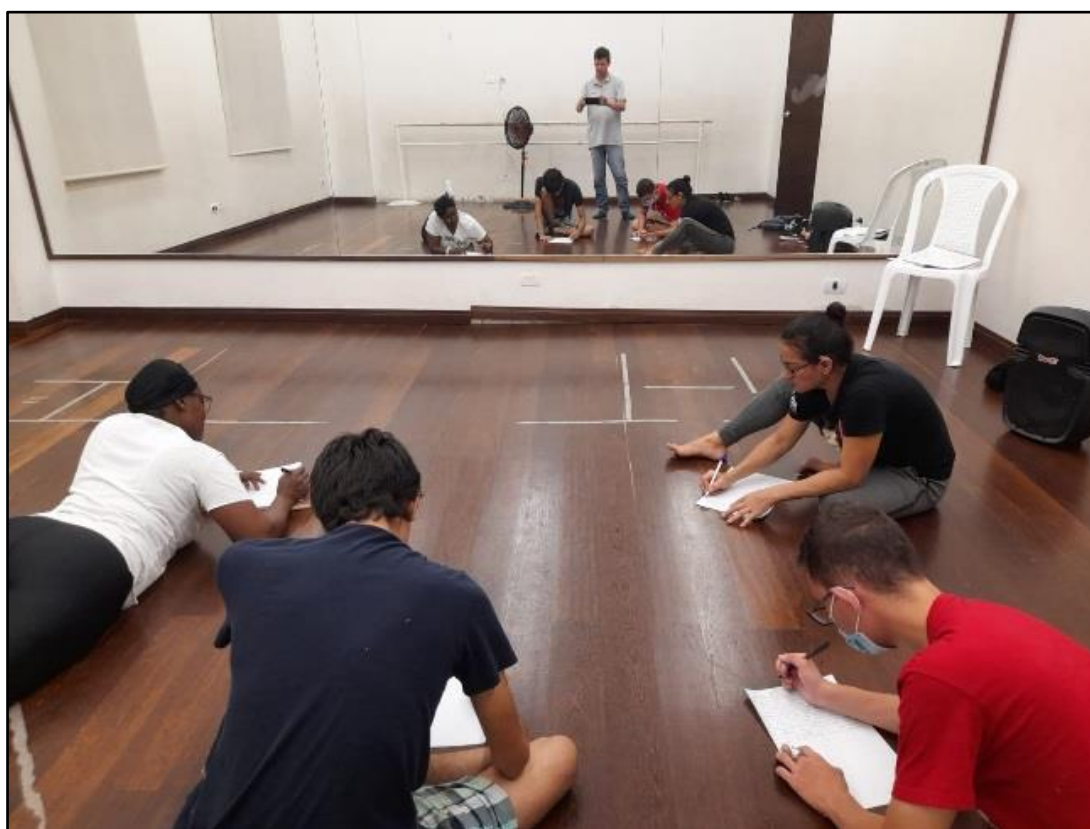
Fotográfico 1, ejercicios de exploración y escritura creativa.