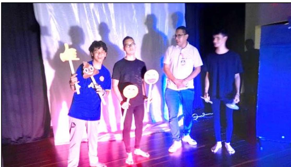
Fotográfico 8. Ensayo con coordinación pedagógica del programa.