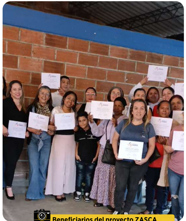
Beneficiarios del proyecto ZASCA Cauca y ZASCA ManriqueAmazonía

Los 120 graduados de los Centros ZASCA de Manrique y Cauca han experimentado una transformación significativa en sus unidades productivas. Algunos de los beneficios obtenidos incluyen: acceso a maquinaria y tecnología especializada, capacitación y asesoría empresarial, espacios de relacionamiento comercial y acompañamiento integral.