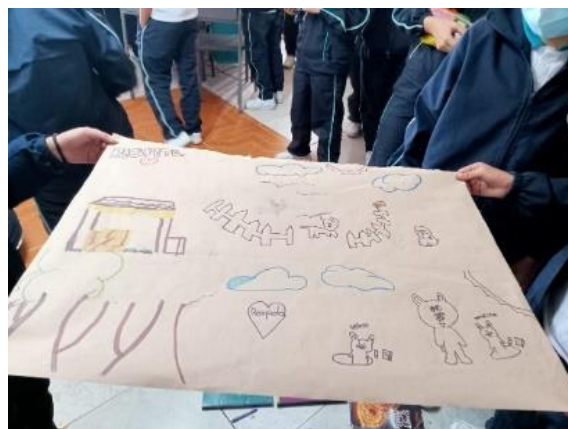
Figura 5: Estudiantes ilustrando por medio del arte