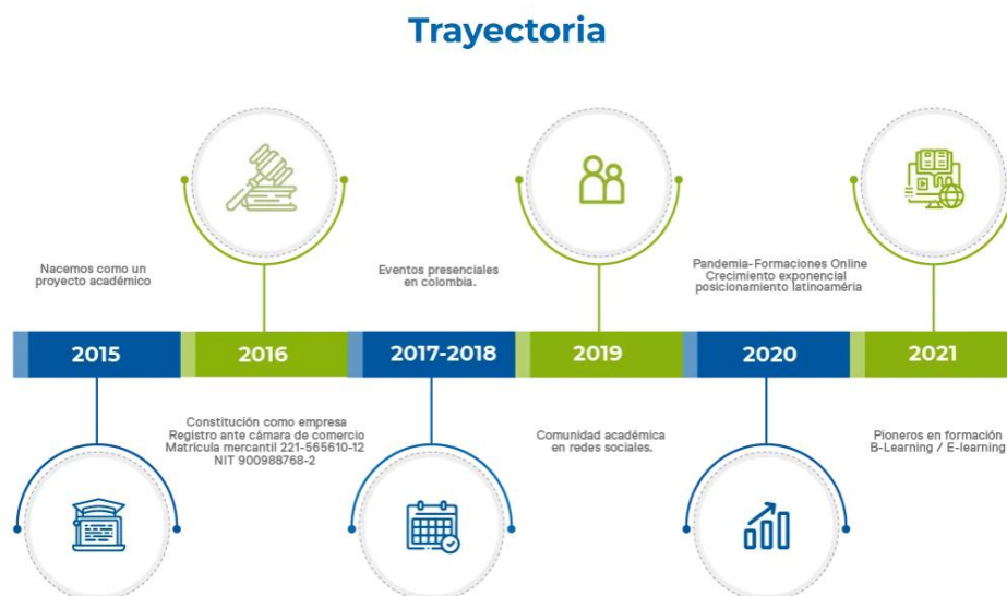
Tabla 2: Trayectoria

Trayectoria de Fisioterapia en Movimiento. 2016. Fisioterapia en movimiento. Página web.