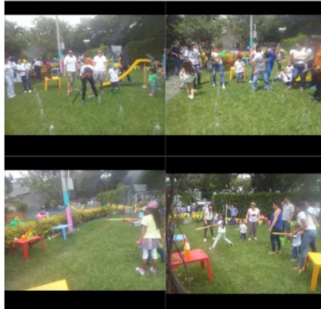
Figura 5. (2023) evidencias actividad 2 [Fotografía]

Explora el mundo que te rodea: al realizar los juegos y participar en las actividades acuáticas, el niño esperó pacientemente su turno para desarrollar el circuito , y así mismo paso cada uno de los obstáculos con facilidad y ayudó a sus compañeros cuando lo necesitaban, en la ejecución de los juegos acuáticos la docente fue un apoyo constante para ellos motivándolos a su ejecución, controlando su movimiento corporal, mejorando su relación y comunicación con los demás.