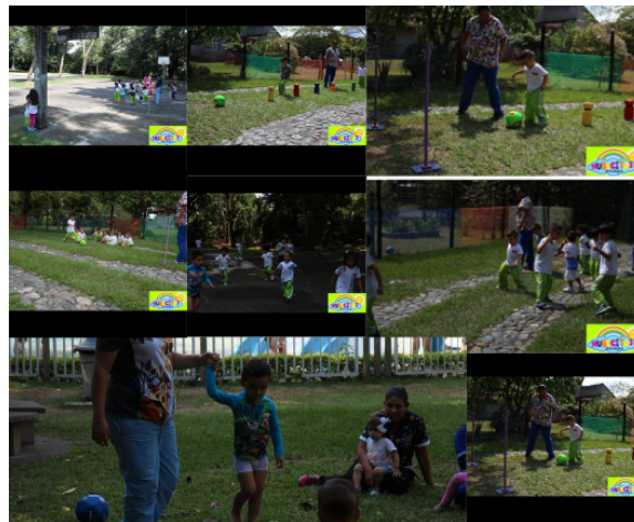
Figura 7. (2023) evidencias actividad 4 [Fotografía]-Fuente esta investigación

Sigue mis huellas: en la ejecución de este juego, los niños disfrutaron del juego de mímicas realizando diferentes gestos y movimientos (subir las manos, mover la lengua, abrir y cerrar los ojos, tocarse las orejas, entre otros), también participaron activamente de la secuencia de los ejercicios, esperando pacientemente los turnos y siguiendo los ejercicios explicados por la docente