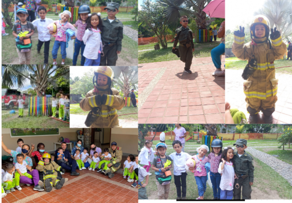
Figura 4. (2023) evidencias actividad 5 [Fotografía]

Intelectual: de acuerdo a Poveda, S. (2015) explica que “A los 5 años, el niño adquiere habilidades y destrezas nuevas que le permiten relacionarse mejor con la realidad, donde adquiere nuevos conocimientos, asimila nueva información y aprende por medio de la experiencia e interacción” (parr.2).