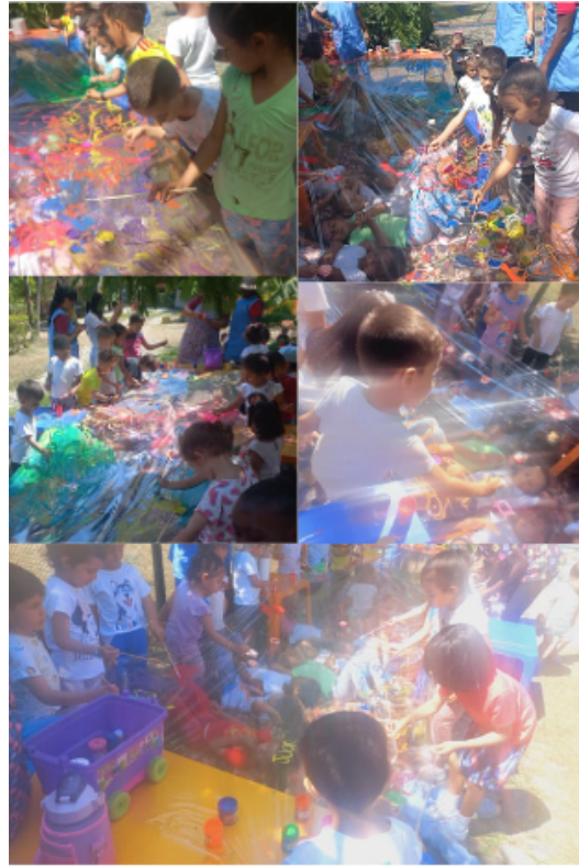
Figura 3. (2023) evidencias actividad 1 [Fotografía]

Sueña y lo lograras: en el desarrollo de la actividad, se logró que los niños estuvieran en un ambiente más natural, acompañados de personas a las cuales admiran como profesionales de apoyo. en el momento de ejecutar el juego el juego de roles disfrutaron mucho poder mostrarles a sus compañeros cuáles son sus preferencias e imitar a sus admiradores. Posteriormente con la visita de los bomberos se mostraron bastantes alegres, motivados y concentrados en las explicaciones de la función de ellos y así mismo poder interactuar con ellos en la dramatización de los ejercicios que desarrollan diariamente.