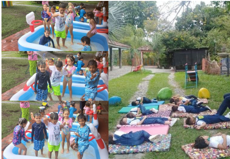
Figura 8. (2023) evidencias actividad 6 [Fotografía]-Fuente esta investigación

compañeritos, y lo más importante se logró que el niño con TDAH se integrará completamente en la actividad evidenciándose su agrado por actividades acuáticas.