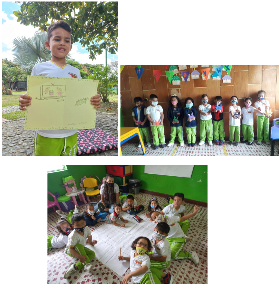
Figura 2. (2023) Observación actividades [Fotografía]

A partir de allí se conoce como es el proceso de adaptación desde que el estudiante ingresa al entorno escolar evidenciándose poca interacción, concentración, habilidades psicomotoras y vinculación con el entorno, debido a esto se ven afectadas sus capacidades socio-afectivas, cognitivas y psicomotoras lo que le hace llamar la atención siendo un distractor para sus compañeros y la clase.