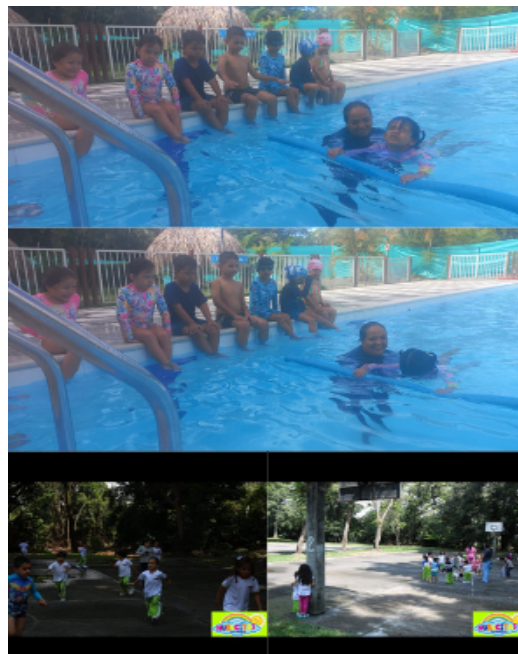
Figura 6. (2023) evidencias actividad 3 [Fotografía]-Fuente esta investigación

Explora el mundo que te rodea: al realizar los juegos y participar en las actividades acuáticas, el niño esperó pacientemente su turno para desarrollar el circuito , y así mismo paso cada uno de los obstáculos con facilidad y ayudó a sus compañeros cuando lo necesitaban, en la ejecución de los juegos acuáticos la docente fue un apoyo constante para ellos motivándolos a su ejecución, controlando su movimiento corporal, mejorando su relación y comunicación con los demás.