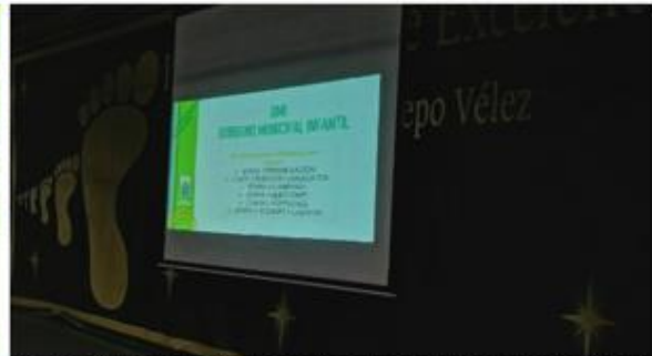
Acompañamiento al proceso de socialización y convocatoria GMI 2025