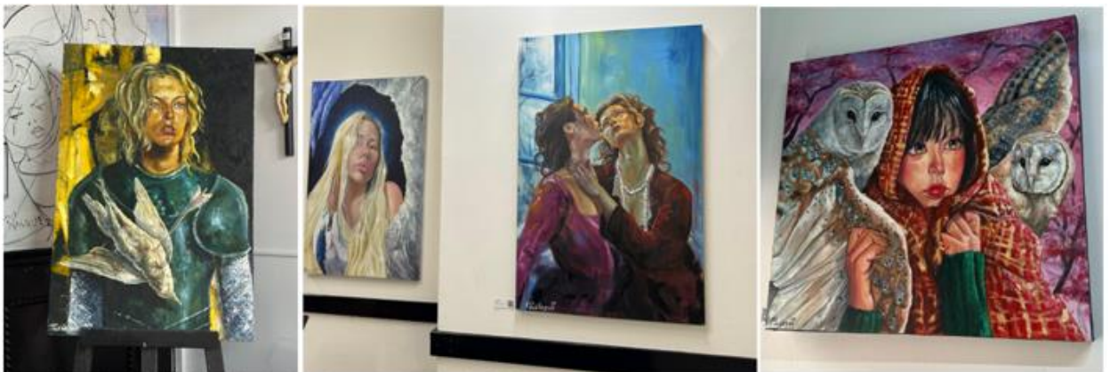
Exposicion Itinerante tercer periodo de sesiones ordinarias año 2024.