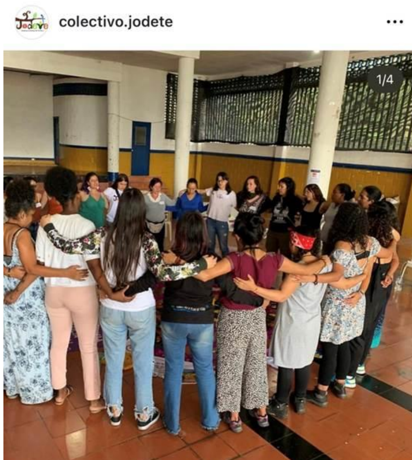
Figura 3. Mujeres del círculo reunidas.

Mujeres reunidas en una de las sesiones del círculo realizado en el Hogar Juvenil del municipio de Tâmesis.