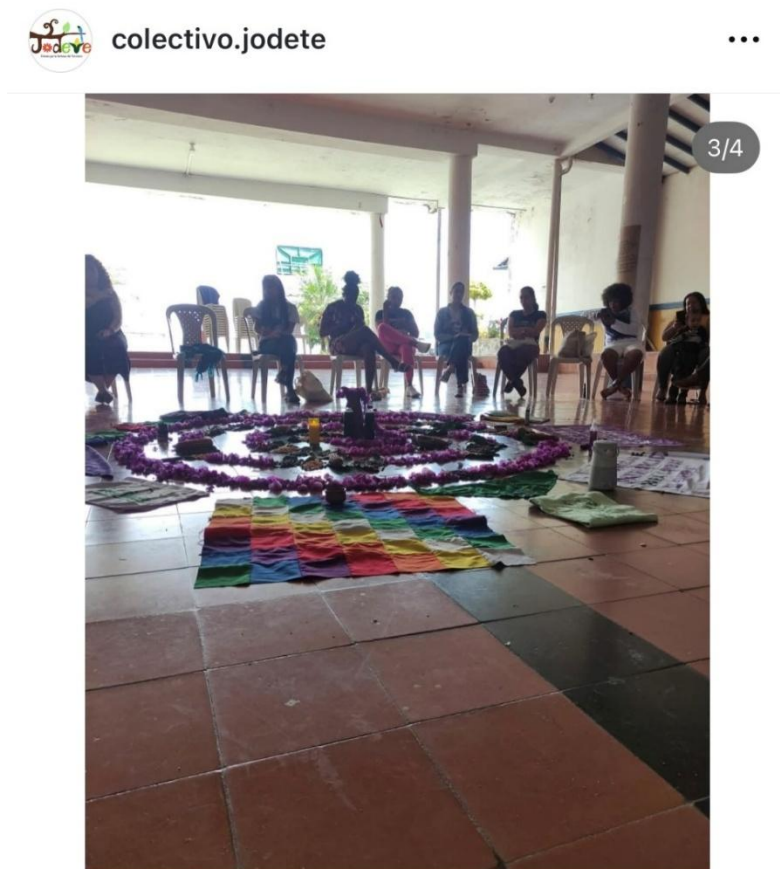
Figura 5. Mujeres del círculo en actividad comunitaria

Participación de mujeres de Támesis y otros municipios del Suroeste antioqueño en una actividad comunitaria del Círculo.