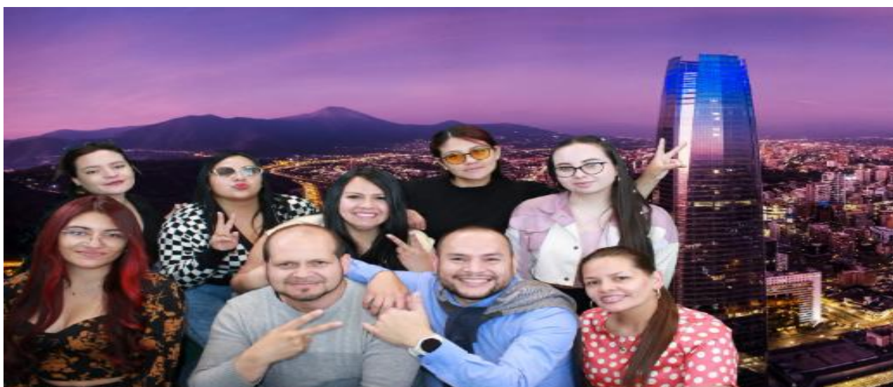
Imagen grupal de la visita turística al edificio Sky Costanera

Nota: Estas imágenes pertenecen a la visita turística al edificio Sky costanera. Elaboración propia.