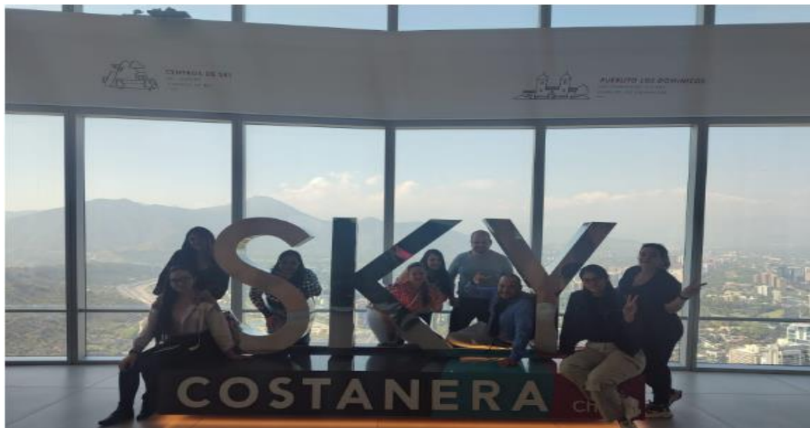
Imagen grupal de la visita al edificio sky Costanera