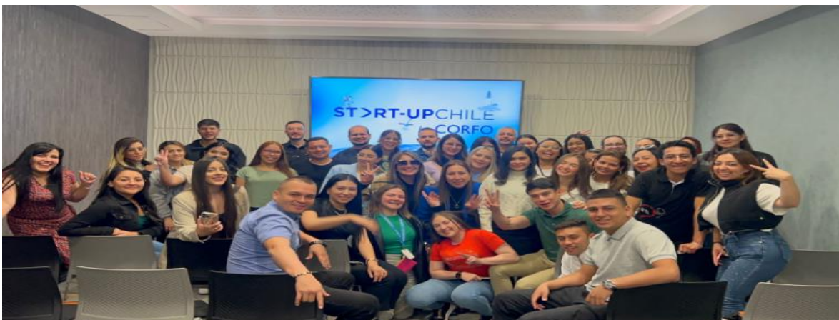
Imagen grupal en la participación de la charla empresarial

Nota: Las imágenes ilustradas muestran la quinta visita realizada durante nuestra experiencia, en la cual el "start-up" de Chile nos ofreció una enriquecedora charla empresarial centrada en los emprendimientos. Durante esta sesión, se abordaron diversos aspectos relacionados con el mundo empresarial y se destacaron las oportunidades y desafíos que enfrentan los emprendedores en el contexto actual. Elaboración propia.