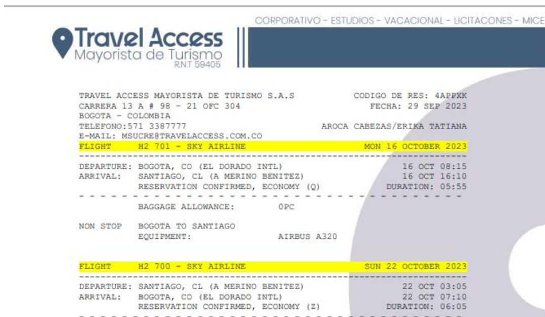
Imagen tiquetes internacionalización Chile

Nota: Uniminuto, itinerario internacionalización chile,2023