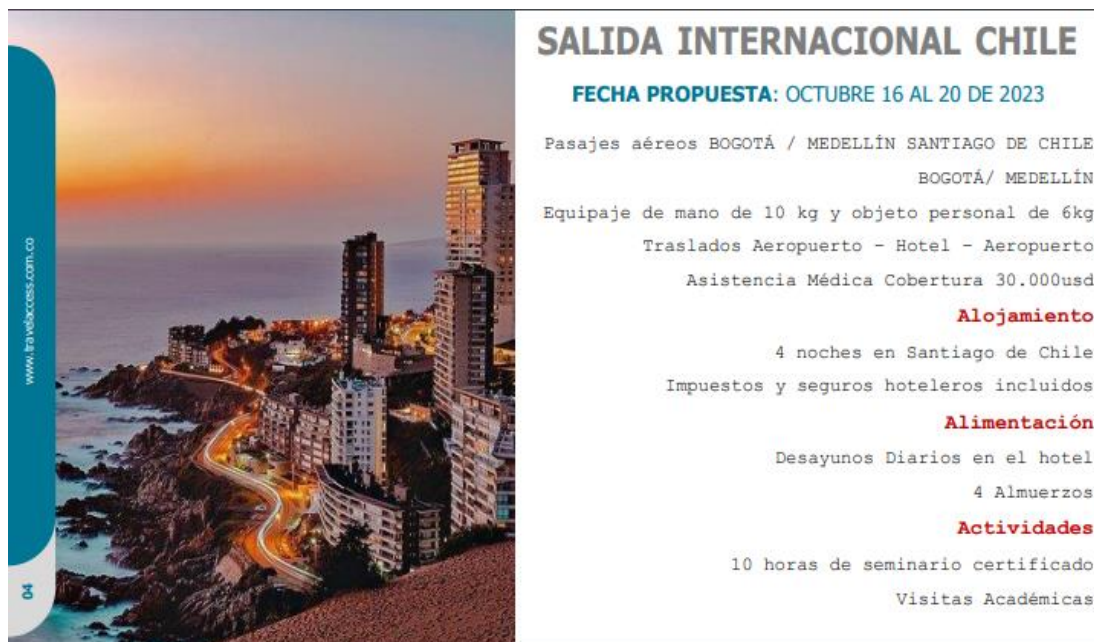
Imagen Especificaciones internacionalización Chile

Nota: Uniminuto, itinerario internacionalización Chile, 2023