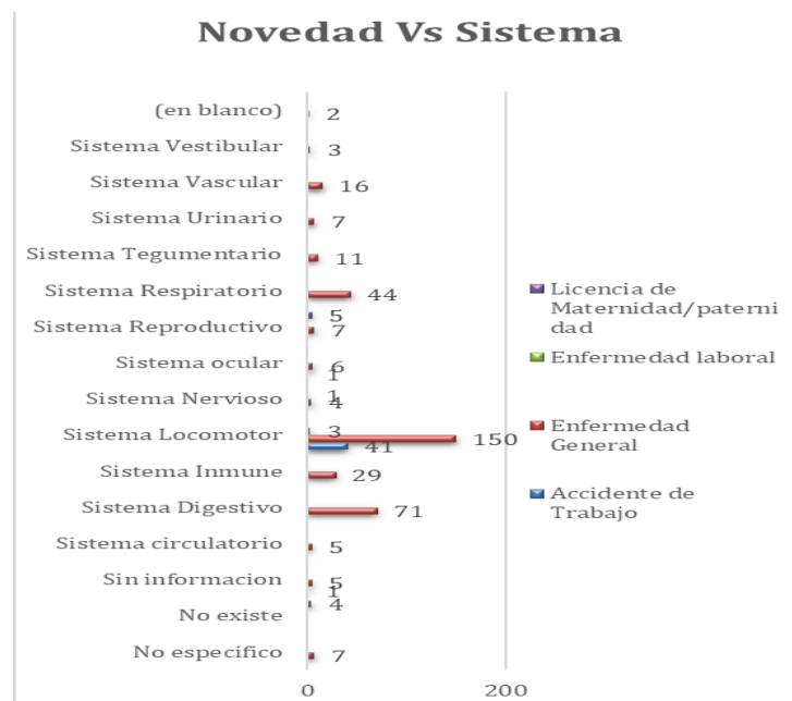
Figura 2. Sistemas afectados de acuerdo a las novedades

Al relacionar las novedades de incapacidad con los sistemas afectados en los trabajadores en donde se ratifica que el sistema más afectado es el locomotor a causa de enfermedades generales en un total de 150 días de ausencias, el digestivo en segundo lugar de importancia con 71 días, tal como se denota en la siguiente Figura 3.