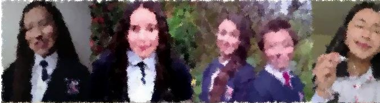
Anexo A. Semillero Club Escolar Sui Genéris.