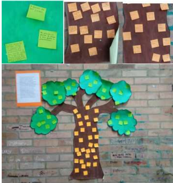
Figura 5. Raíces de un mismo árbol. Mediación didáctica. Elaboración propia.

Con base en las sugerencias planteadas y el análisis de la ficha de observación se desarrolló la estrategia 2, la cual consistió en que los estudiantes debían personalizar una silueta del ser humano, teniendo en cuenta que los símbolos y los elementos con que llenaban las siluetas son el reflejo de cada uno. El objetivo de esta estrategia fue fomentar el respeto a la diversidad cultural a través de la auto reflexión y la representación simbólica. Luego se pegaron las siluetas en la pared y cada compañero trataba de identificar a quien corresponde a cada silueta, el ejercicio fue enriquecedor ya que los estudiantes lograron reconocer sus diferencias y sus características que los hacen auténticos, la reflexión final conduce a fomentar el respeto por todas las particularidades. Esta estrategia se alinea con el enfoque educativo sustentado por (Gómez, 2017) que enfatiza la importancia de la personalización y la expresión individual como medios para promover la reflexión sobre la diversidad cultural.