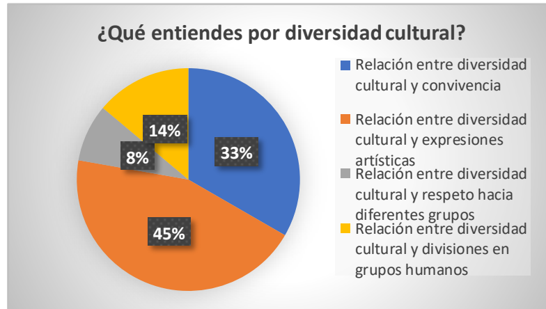
Figura 1. Relación del concepto de Diversidad Cultural Elaboración propia.

Esta categorización demuestra que los estudiantes tienen cierto conocimiento sobre la diversidad cultural, como la importancia de la convivencia entre diferentes culturas, la expresión artística y cultural, el respeto hacia diferentes grupos y la existencia de divisiones en grupos humanos, lo cual concuerda con los postulados de Kymlicka (1995) en que la diversidad cultural en el aula se da en mayor medida por factores socioculturales. La mayoría tienen una percepción positiva de la diversidad cultural asociándola a la construcción de sociedades inclusivas. Sin embargo, es necesario que las estrategias propendan por fomentar la sensibilización sobre el tema para una comprensión más profunda y una apreciación más general.