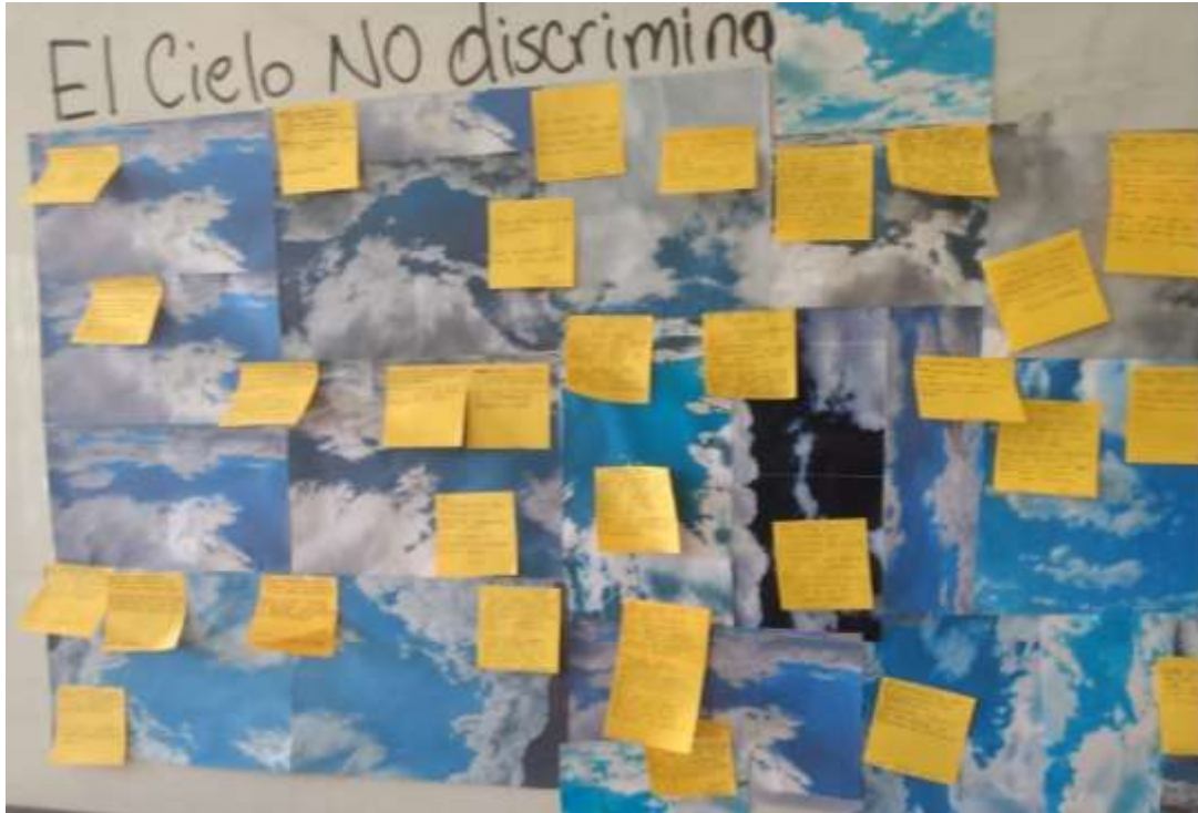
Figura 8. El cielo no discrimina. Instalación fotográfica.

como lo sugiere (García y otros, 2017). Estas estrategias se alinean con los principios de la educación inclusiva e intercultural, promoviendo la colaboración entre estudiantes, la expresión individual y el respeto por las diferencias culturales. Además, el análisis de las estrategias destaca la necesidad de adaptar las actividades didácticas a las características y necesidades de los estudiantes, como lo subraya (Amos, 1971) procurando enseñar todo a todos.