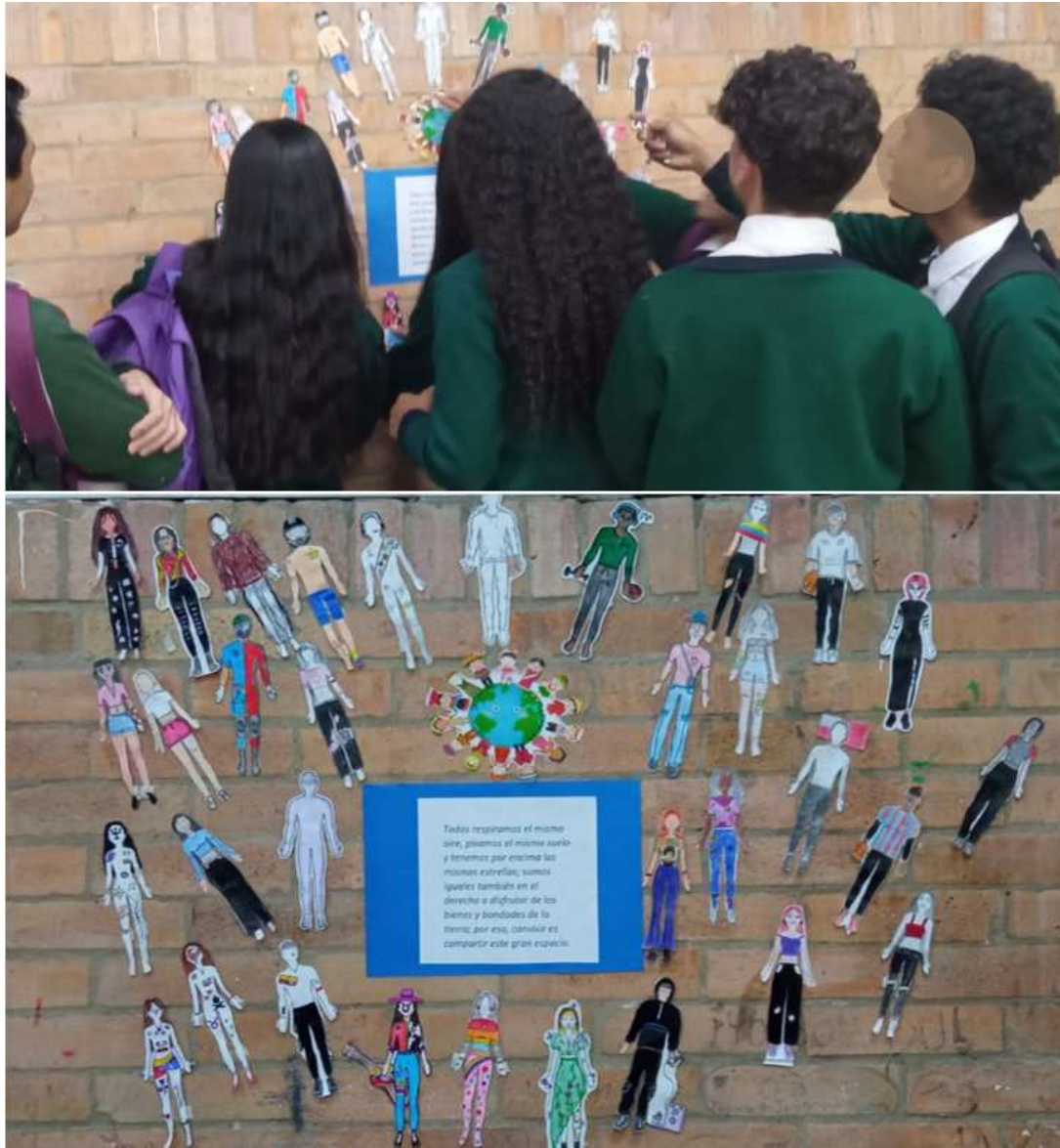
Figura 6. Ser autentico. Mediación didáctica. Elaboración propia.

respecto a su identidad, la estrategia demás fomento de manera espontanea la interacción entre estudiantes, pues fue necesario extender la actividad para la contemplación de las siluetas en las que los estudiantes trataban de reconocer a sus compañeros por sus gustos y cualidades más allá de las características físicas, un momento que generó la ruptura de estereotipos y prejuicios, como se observa en la figura 6.