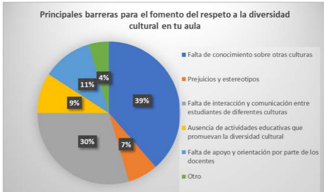
Figura 3. Barreras que afectan el fomento a la diversidad Cultural. Elaboración propia

De este modo las principales barreras serían: la falta de conocimiento sobre otras culturas es identificada como la principal barrera por los estudiantes. Esto destaca la importancia de la educación intercultural para abordar esta carencia. Los prejuicios y malentendidos son la segunda barrera más comúnmente identificada. Esto sugiere que se deben abordar los estereotipos y prejuicios que los estudiantes puedan tener hacia personas de diferentes culturas. La falta de oportunidades para interactuar con personas de diferentes culturas también se identifica como una barrera. Promover la interacción cultural puede ser clave para fomentar el respeto y la comprensión mutua. Algunos estudiantes mencionan actitudes racistas y falta de respeto verbal entre compañeros como barreras adicionales. Esto resalta la necesidad de abordar el comportamiento discriminatorio en el aula.