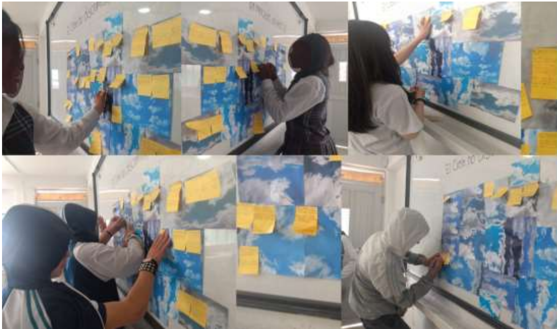
Figura 7. Participación de estudiantes. Mediación didáctica. El cielo no discrimina.

Finalmente, una vez evaluada la estrategia se planteó la estrategia 3 “Bajo el mismo cielo” en esta estrategia se fortaleció el ejercicio artístico como un detonante para la vinculación del estudiante y un dinamizador de la reflexión individual y colectiva, teniendo en cuenta las mejoras propuestas, se le pidió a cada estudiante traer una fotografía impresa de un rozo de cielo, se realizó la instalación de las fotografías y se les solicitó la socialización de lo que para cada uno significaba la imagen fotografiada, posteriormente se realizó la analogía entre la instalación fotográfica y el respeto por la diversidad cultural, teniendo en cuenta que independientemente de algunos prejuicios que se suelen tener el firmamento es un elemento natural que no discrimina en prejuicios ni estereotipos, el sol brilla igual para todos, la lluvia cae igual para todos, y todos estamos bajo el mismo cielo, una situación que nos genera un carácter de unión como seres humanos.