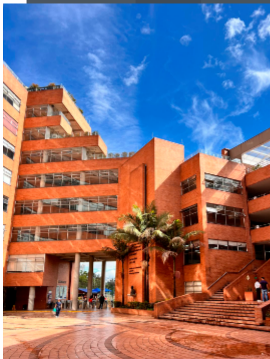
Nuestra cubierta: Tarde soleada y un cielo despejado sobre la sede de UNIMINUTO Bogotá.

E n el año 2024, las rectorías de Bogotá y Cundinamarca de UNIMINUTO unificaron esfuerzos para integrar sus Direcciones de Investigación, con el propósito de fortalecer y consolidar los procesos académicos y científicos en una región más amplia que ahora abarca 16 Centros Universitarios distribuidos en Bogotá, Cundinamarca y Boyacá. Este proceso de integración busca no solo optimizar la gestión administrativa de la función sustantiva, sino también establecer una base sólida para desarrollar investigaciones con mayor impacto social en las comunidades donde UNIMINUTO tiene presencia. La coordinación de estos esfuerzos permitirá articular procesos clave como el fortalecimiento de los semilleros de investigación, grupos de investigación, publicaciones; así como el seguimiento a proyectos en áreas estratégicas para el desarrollo local, como la educación, la agricultura, el uso de tecnologías, el desarrollo y la innovación social, entre otras, acciones enmarcadas en la Ecología Integral, compromiso de la obra del Minuto de Dios con el Desarrollo Social Integral Sostenible.