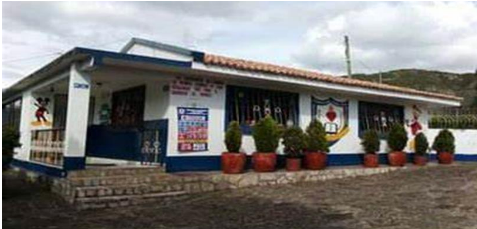
Ilustración 2. Colegio Campestre Corazón de Jesús. Lenguazaque.

El Colegio Campestre Corazón de Jesús se encuentra ubicado a 2 kilómetros del perímetro urbano del municipio de Lenguazaque en la vereda Resguardo, con acceso por una vía carreteable de fácil circulación por la salida a Villapinzón. Es un colegio privado que brinda educación formal. Cuenta con 13 docentes que tienen formación normalista, técnico, licenciado e incluso hasta magister; con 130 niños de la zona y alrededores; para los grados preescolar (prejardín, jardín y transición), primaria y básica media (bachillerato). El colegio cuenta con diferentes tipos de familias tales como: compuesta, ensamblada, monoparental. La mayor parte de la población estudiantil habita en el casco urbano. Las actividades económicas de los padres de los estudiantes son esencialmente labores mineras, ganaderas, agrícolas y comerciales.