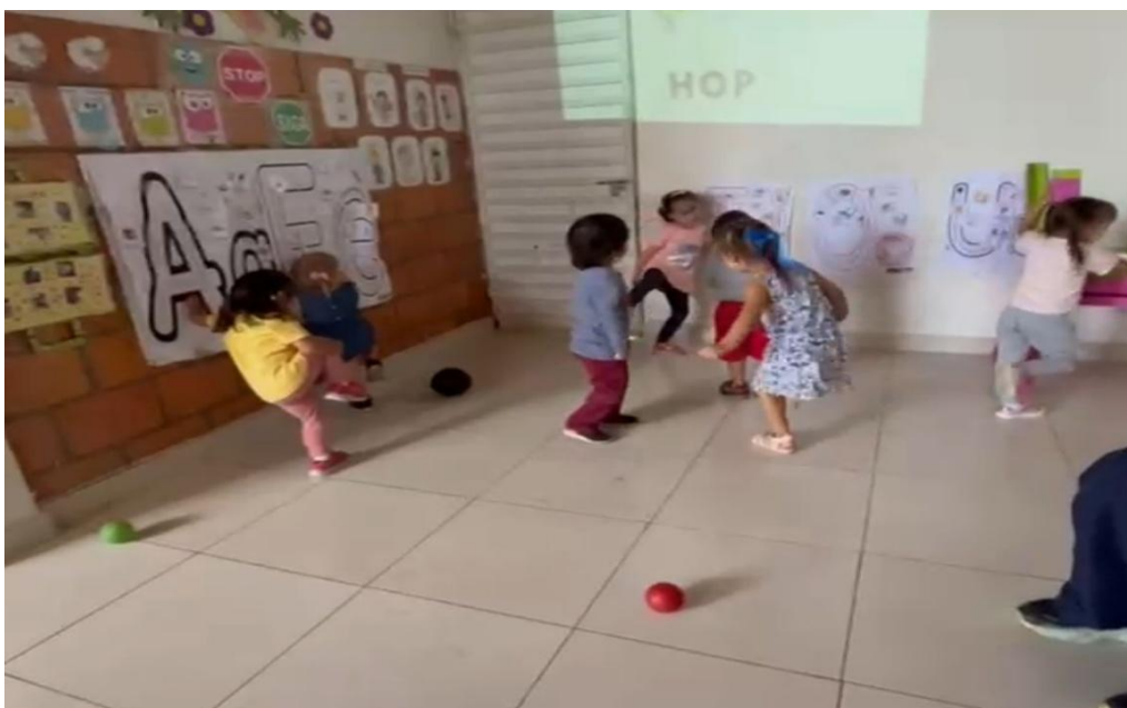
Anexo I: Evidencias fotográficas de Atención a la Diversidad