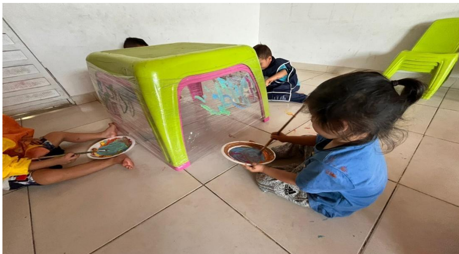
Anexo H: Evidencias fotográficas de Ambientes de Aprendizaje