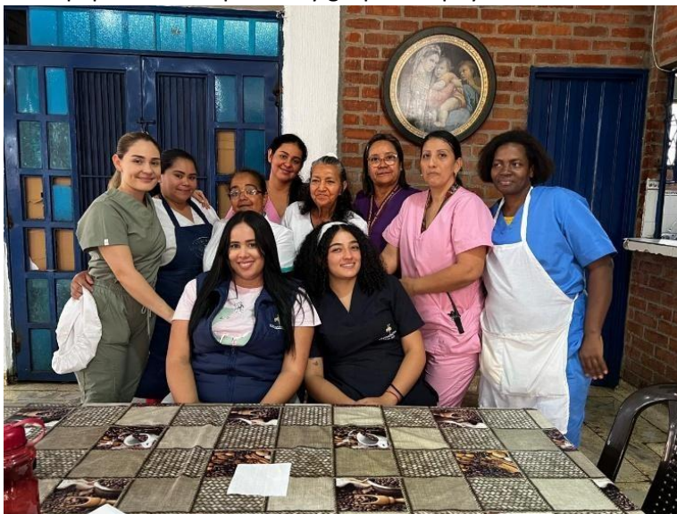
Ilustración 3. Equipo interdisciplinario y grupo de apoyo del centro de atención al adulto mayor