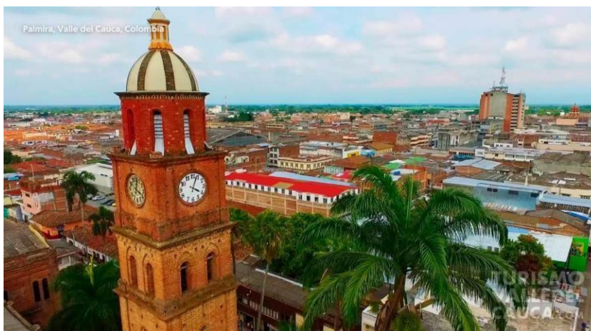
Ilustración 1. Palmira, valle del cauca.