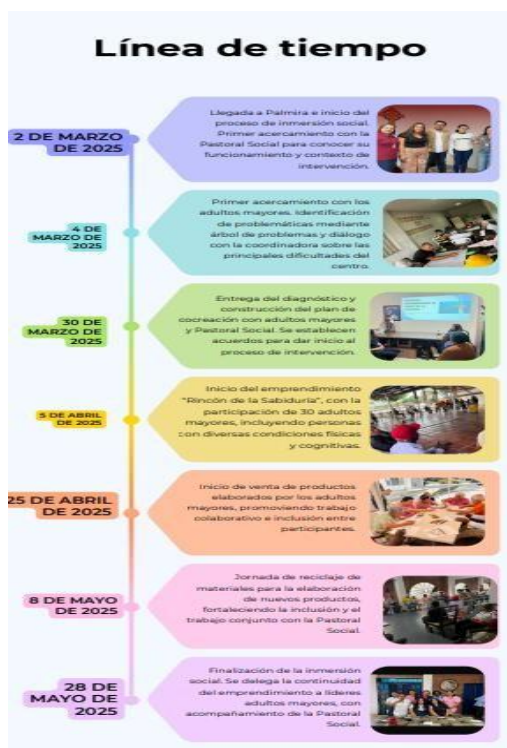
Ilustración 8. Línea del Tiempo