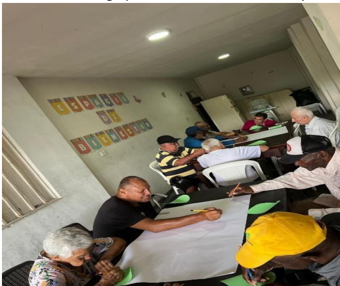
Ilustración 4. Actividad grupal de memoria, socialización y trabajo colectivo con adultos mayores