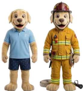
Imágenes creadas con Gemini