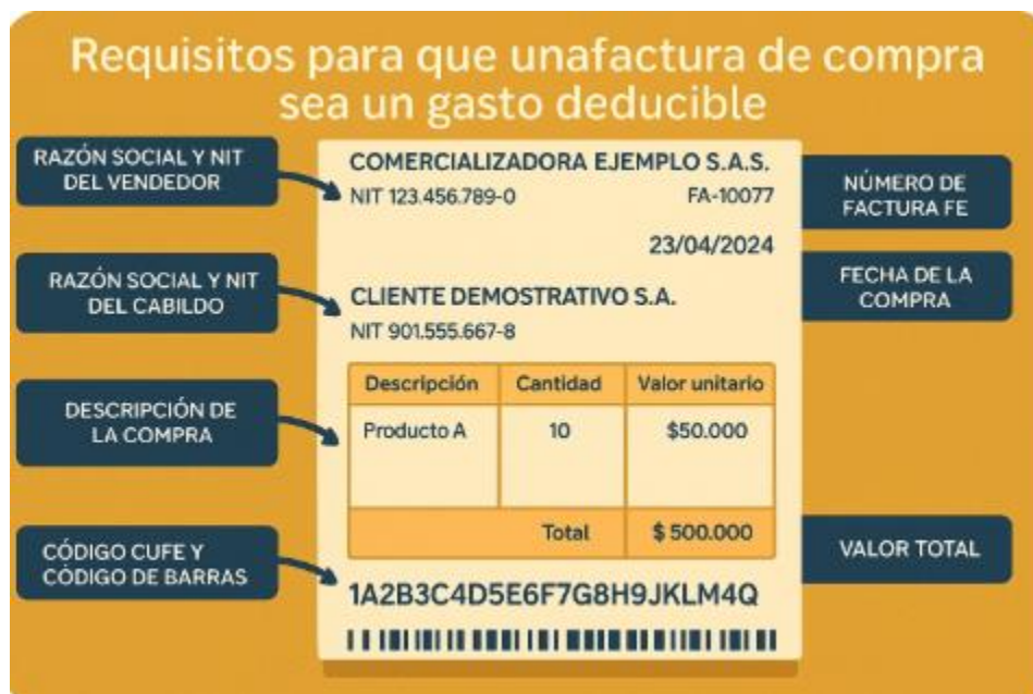
Figura 1 Factura válida

Para más información sobre esta factura ver video explicativo en el siguiente enlace.