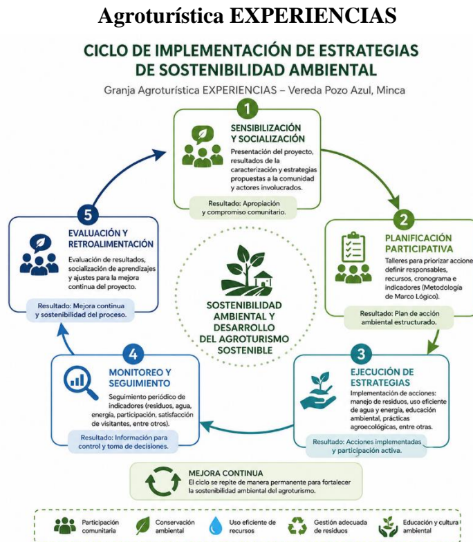
Gráfico 3. Ciclo de implementación de estrategias de sostenibilidad ambiental en la Granja