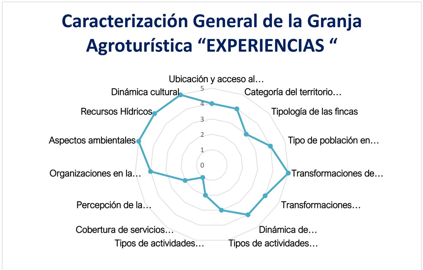
Figura 1. Gráfico Radial Caracterización general de la Granja Agroturística “EXPERIENCIAS “en su contexto rural.