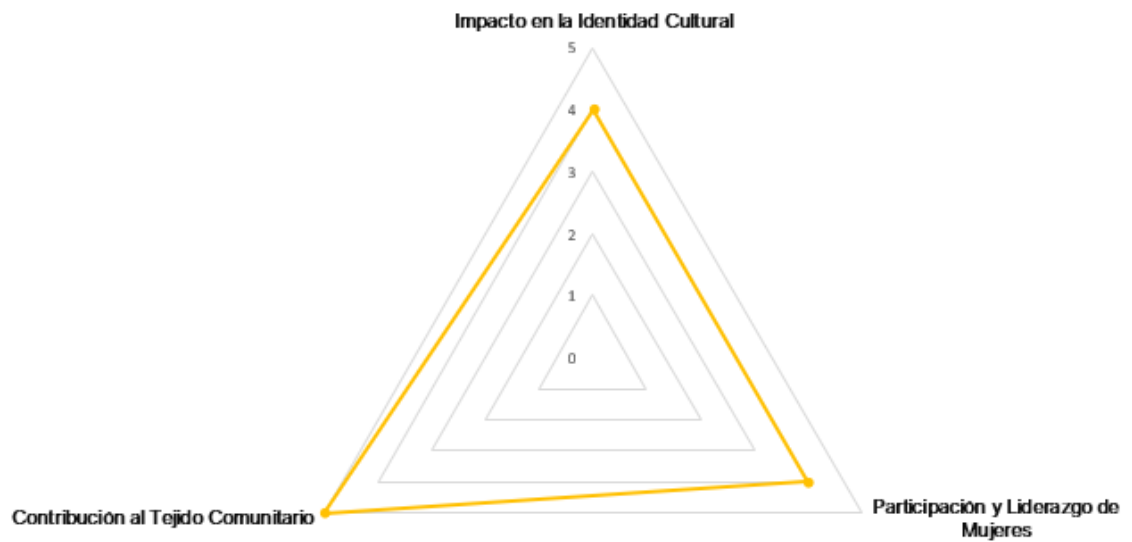
Figura 2 Gráfico Radial Caracterización específica de del emprendimiento empresarial de las Varas "AFROMUVARAS en el ámbito social