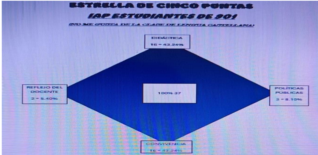
Figura 2. Estrella de 5 puntas

(Estudiantes de 901 LRLv- Frente a la lo que NO me gusta de las clases de lengua castellana)