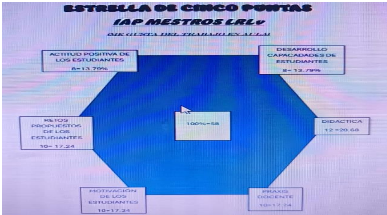
Figura 4. Estrella de 5 puntas

(Maestros del LRLv- Frente a lo que le gusta de la docencia en el colegio)