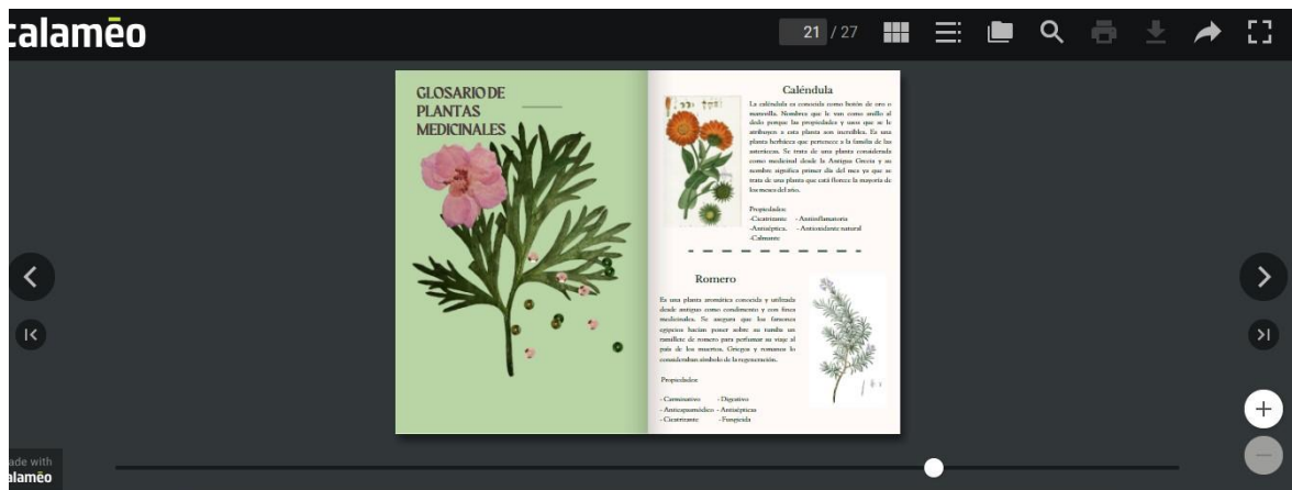
Figura 6- Revista entre aromas y tradiciones- Recuperado de:

https://www.calameo.com/read/0075290912b6141457128