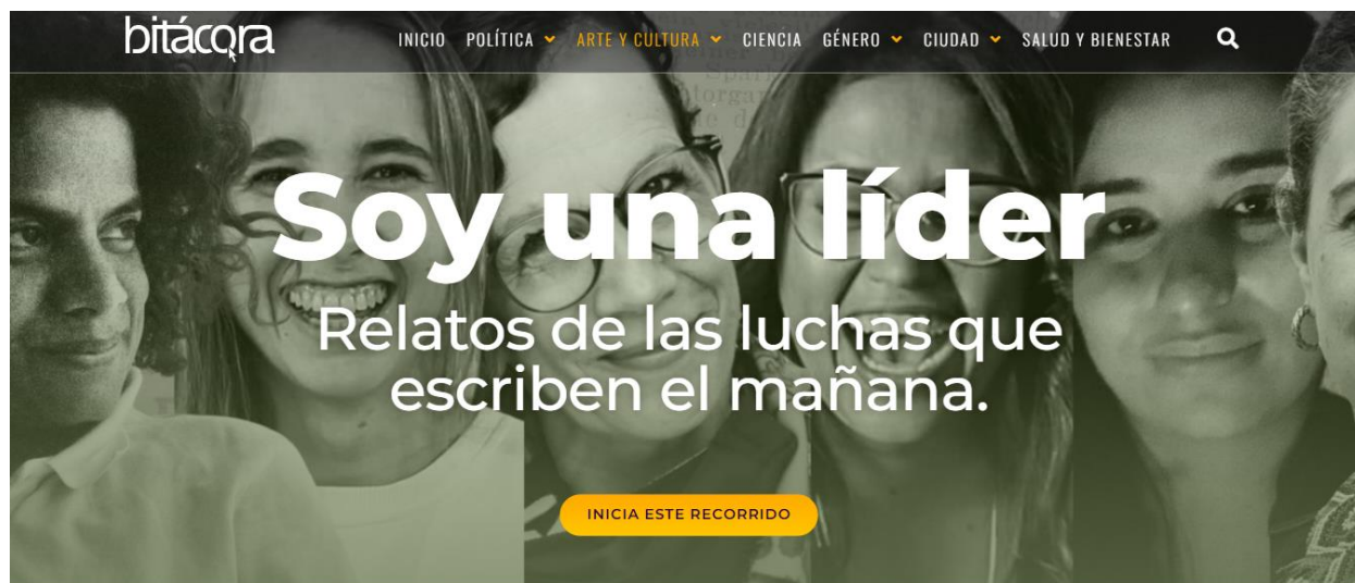
Figura 3- Liderazgo femenino: relatos de las luchas que escriben el mañana-Recuperado de:

https://bitacora.eafit.edu.co/soy-una-lider/