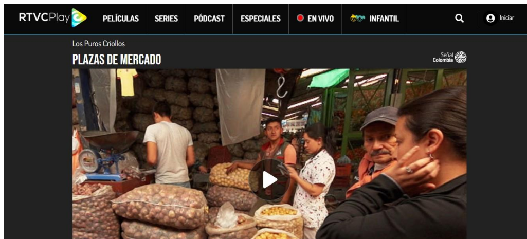
Figura 7- Los puros criollos- Recuperado de:

https://rtvcplay.co/series-documentales/los-puros-criollos/plazas-mercado