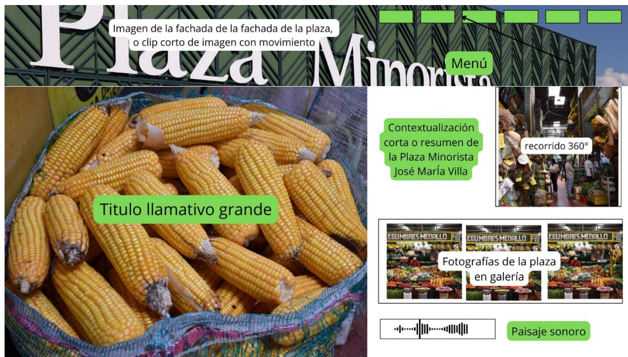
Figura 9-Bosquejo Reportaje digital