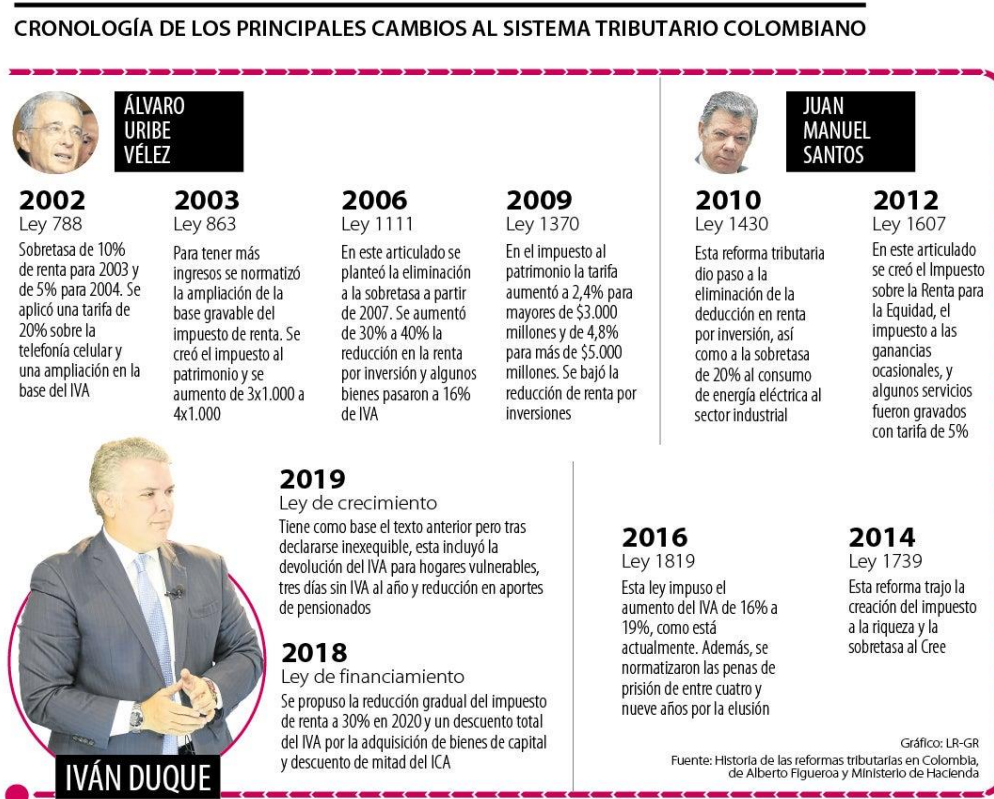
Figura 2 Cronograma de los cambios al sistema Tributario

Durante las últimas décadas las reformas tributarias se han caracterizado por aumentar la recaudación impositiva y poder influir en el gasto de inversión y disminuir la deuda externa del país.