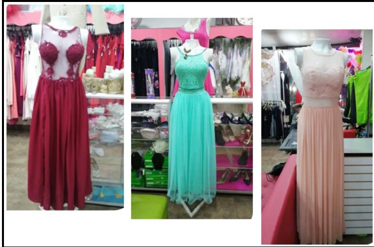
Vestido para Dama