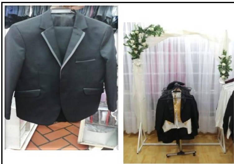
Traje para Niño