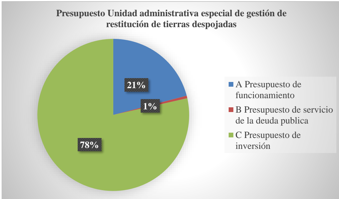
Figura 1. Presupuesto General de la Nación, asignado a la URT para la vigencia 2023.

Fuente: Elaboración propia con base en Ley 2276 de noviembre 29 de 2022. Cifras en millones de pesos.