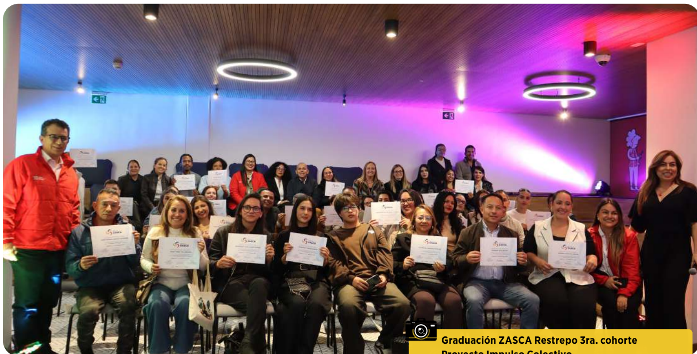
Graduación ZASCA Restrepo 3ra. cohorte Proyecto Impulso Colectivo