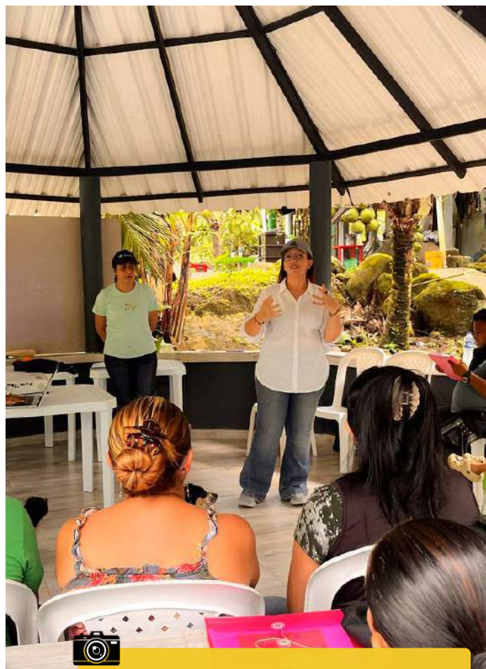
Proyecto Impulso Colectivo

y organizaciones a sumarse, mediante alianzas y convenios que amplíen el alcance de estos programas y multipliquen su impacto en los territorios.