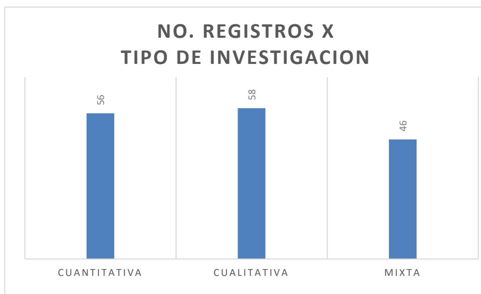
Figura 3 Tipo de investigación

En lo que respecta al tipo de investigación, la información encontrada arrojó que el 35% de los registros se abordaron a partir de un enfoque cuantitativo. Por su parte el 36% de ellos se abordaron desde un enfoque cualitativo. Finalmente, un 29% de los registros en cuestión tuvieron un enfoque de investigación mixto. La siguiente tabla respalda la información dicha anteriormente