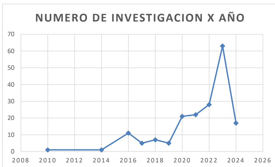
Figura 2 Investigaciones por año

El marco temporal de los documentos que aluden a la inteligencia artificial arrojó los siguientes resultados: