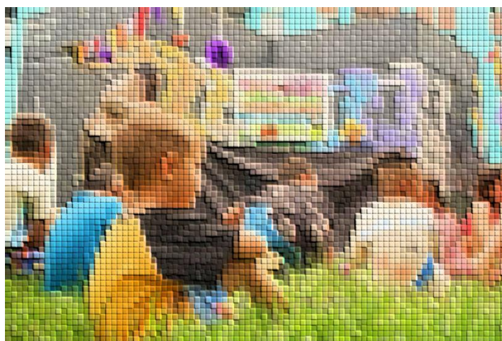
Figura 8. Fiesta de Halloween – octubre 2023.

recreación con los niños, almuerzo y al final se rifan algunos disfraces que son donados, para los niños que no cuentan con un disfraz para el 31 de octubre, por eso la fiesta siempre se realiza antes del 31; esta actividad termina siendo una estrategia para dar a conocer al colectivo y para fomentar más espacios de integración para las personas del barrio, porque siempre logran tener bastante participación por parte de la comunidad.