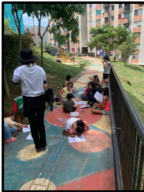
Figura 4. Comité de niños.

Lo cual fortaleció el trabajo colaborativo por parte de los integrantes, que al pasar de los meses trabajaron y se esforzaron por cada vez más reforzar esas estrategias de trabajo, ejecutando acciones para mejorar su actuar.