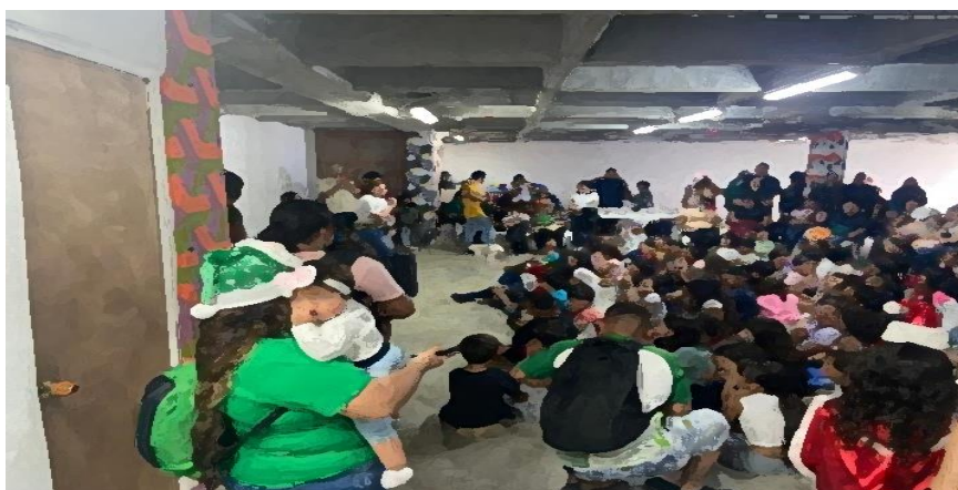
Figura 7. Fiesta de navidad – diciembre 2023.

fue la más grande, ya que no solo contó con la participación del Tirol 3 sino que también del Tirol 2 y 1, y fue con el apoyo de otros colectivos entregando alrededor de más de 200 regalos a los niños. En general estas fiestas conllevan una comparsa por todo el barrio con los niños, pintucaritas, recreación y actividades para los niños, realización de almuerzo, natilla y buñuelos y siempre termina con la entrega de regalos que se consiguen a través de donaciones; en sí, esta fecha es en la que más participación se cuenta por parte de la comunidad y es la que más genera integración entre ellos mismo y con el colectivo, porque la comunidad aporta desde lo tiene y puede dar, algunos ayudan hacer el almuerzos, otros la natilla y los buñuelos, y alguno con la montada del fogón trayendo leña y piedras, creando un espacio de diversión e integración para toda la comunidad, y el colectivo cuando van a entregar los regalos, dedican una reflexión haciendo alusión a que todo es posible con las donaciones y apoyo de otras personas, y que así mismo se pueden lograr las cosas en el barrio con el apoyo de todos, apuntando a sus objetivos de generar conciencia en el barrio.