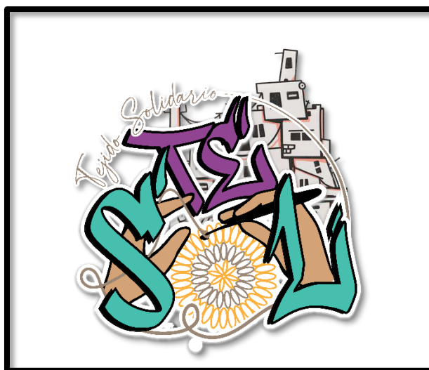
Figura 2. Logo del Colectivo TESOL.

Para comenzar a hablar un poco acerca de la historia y los inicios del colectivo, se logra visualizar, que en un principio el colectivo no contaba con un nombre propio, sino que era la conformación de varios colectivos, que al pasar de los meses se dio cuenta del impacto que tenía en esta comunidad, y vieron la necesidad de tener un nombre con el cual fuesen distinguidos, y así, cerca de los seis meses de conformación escogieron nombrarse Tejido Solidario o como mejor los conocen TESOL .