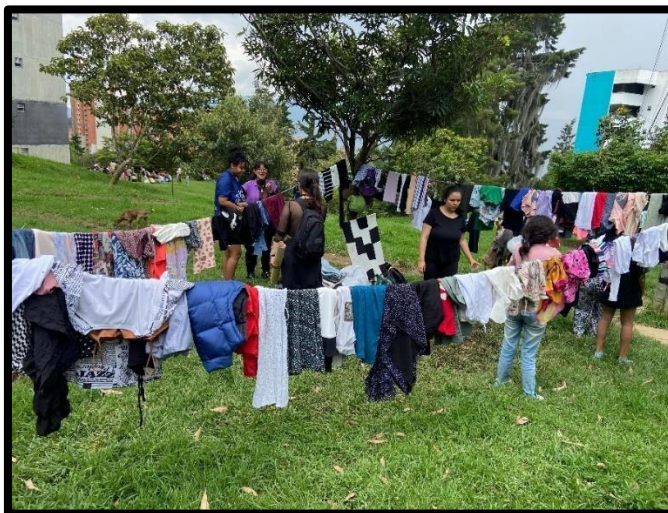
Figura 9. Bazar popular en el barrio – agosto 2022.

personas del barrio se llevan la ropa, pero deben dar otra que es donada a los habitantes de calle. Normalmente estos bazares logran tener bastante participación y el colectivo aprovecha para comentar las actividades, sus intenciones y darse a conocer.