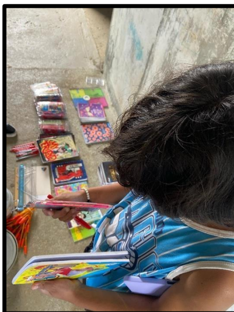
Figura 13. Entrega de útiles escolares – febrero 2025.