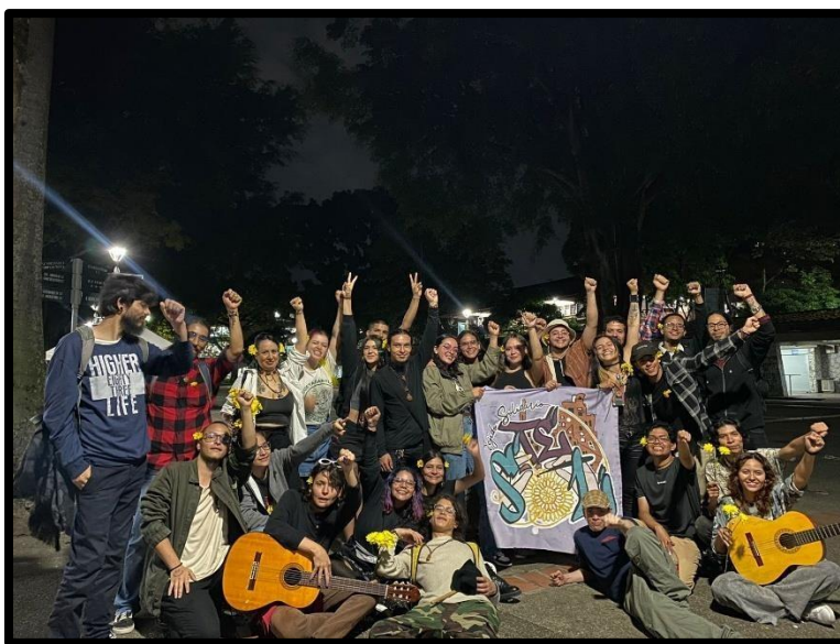
Figura 1. Integrantes del Colectivo TESOL.

El colectivo Tejido Solidario nace aproximadamente en agosto de 2022, gracias a que un habitante de la urbanización Tirol III, que hacía parte de colectivos políticos y era cercano a los integrantes del actual colectivo TESOL, les comenta sobre las situaciones económicas y sociales por las que atraviesa el barrio, es así como los miembros del colectivo se disponen a ir y conocer dichas situaciones, encontrándose con un barrio cuyos habitantes están dispuestos a trabajar para transformar