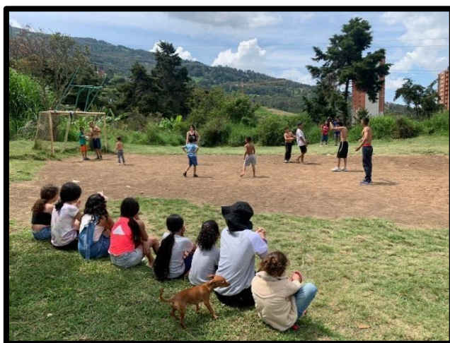
Figura 6. “Cotejo” o partido de fútbol – junio 2024.