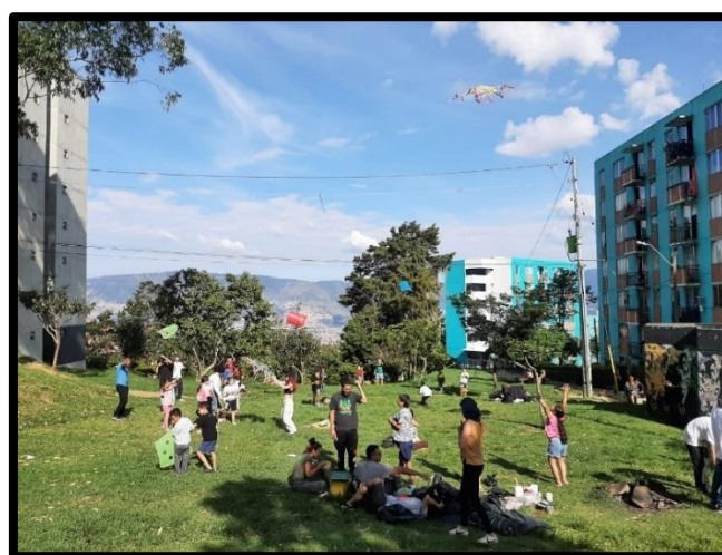
Figura 12. Festival de la cometa – agosto 2024.