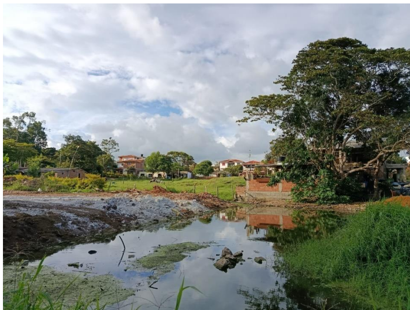
Centro Poblado San Miguel