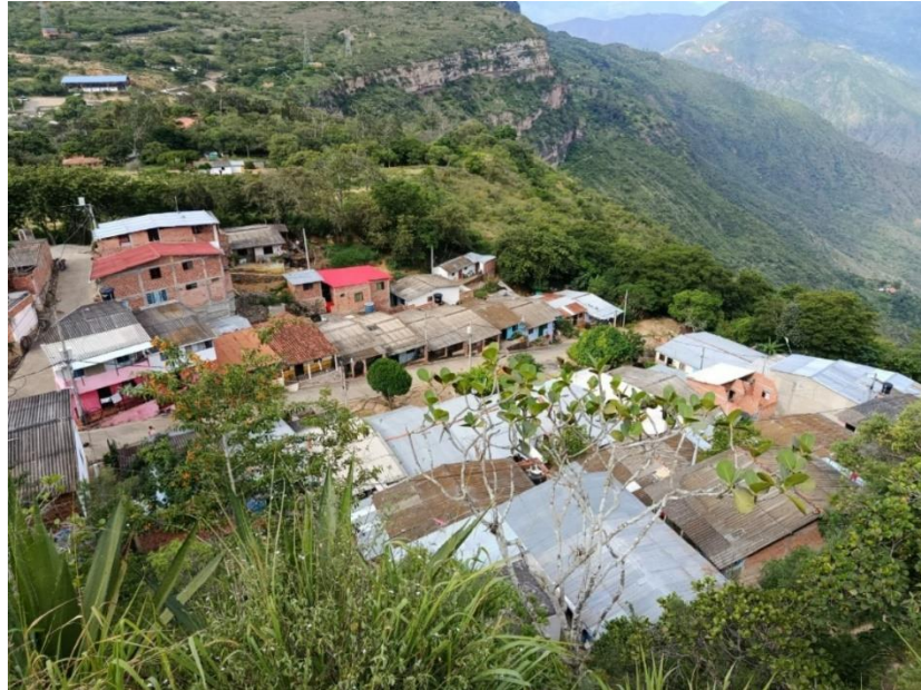
Centro Poblado San Martín