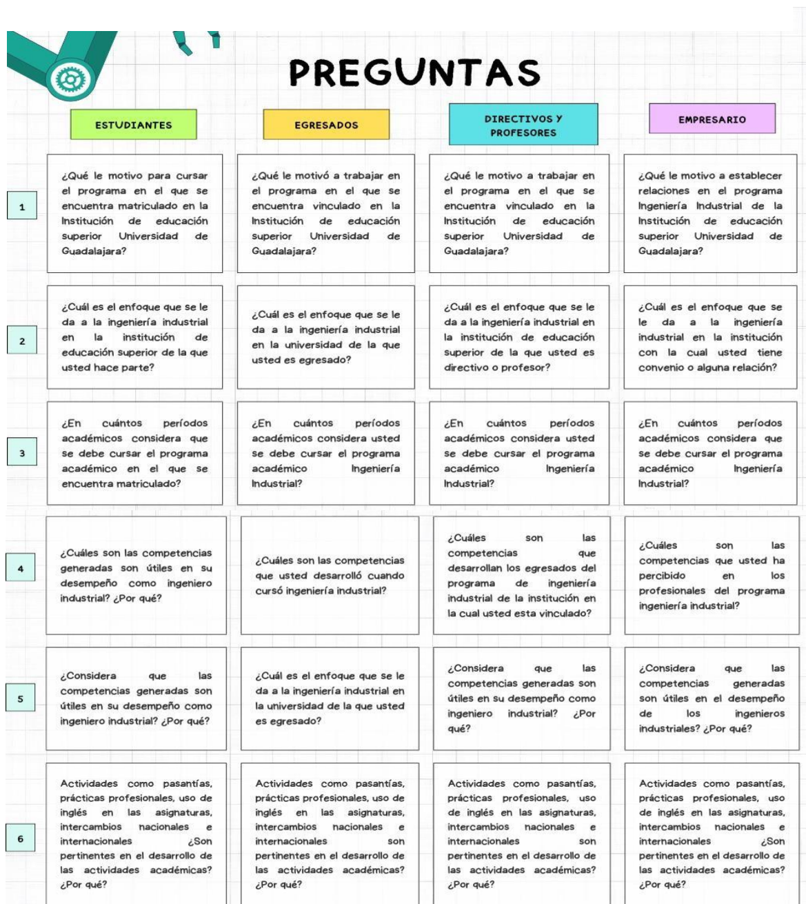
Figura 6-1. Preguntas a encuestados.