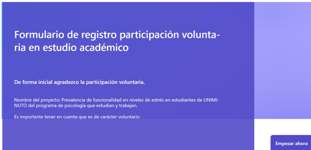
Ilustración 2 Formulario de inscripción

Nota: Formulario implementado para la inscripción voluntaria de la población en la participación del estudio académico Experiencias de funcionalidad frente al estrés en estudiantes trabajadores del programa de Psicología de UNIMINUTO entre los 24 y 30 años.