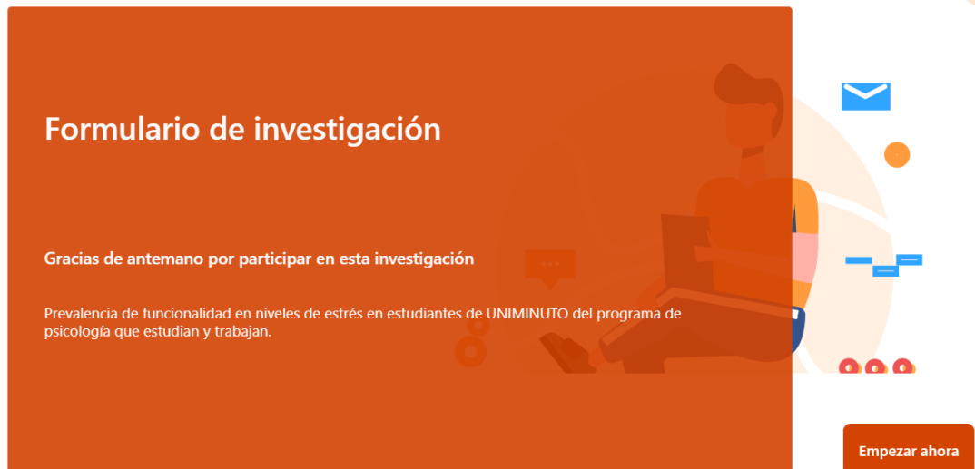
Ilustración 5 Formulario entrevista semiestructurada

Nota: Formulario elaborado para la realización de la entrevista semiestructurada con los participantes.