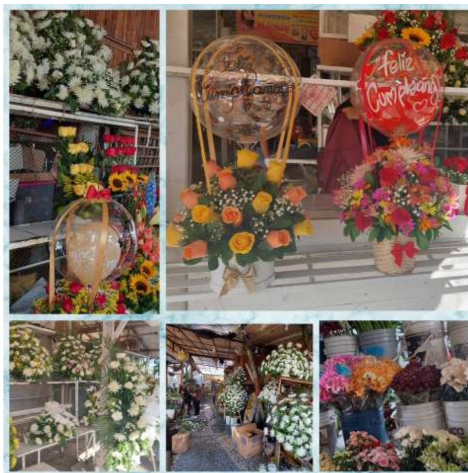
Collage de flores del Parque Romero