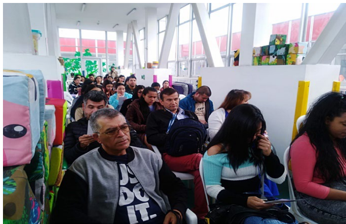
Ilustración 3 Actividad Corresponsabilidad Parental Jardín El Nogal de la Esperanza.