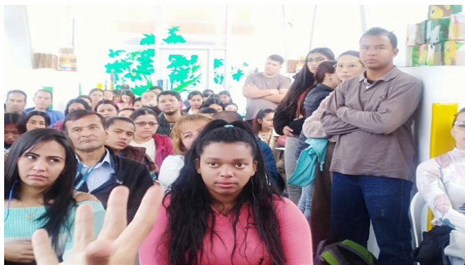
Ilustración 4 Actividad Interinstitucional