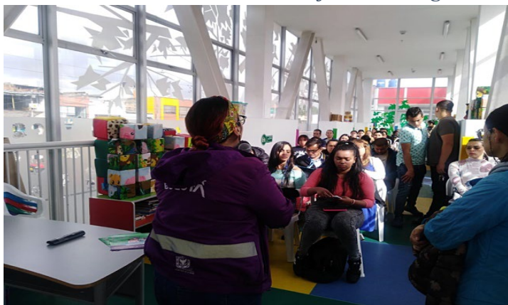
Ilustración 2 Actividad Jardín Infantil El Nogal .

A continuación, se relacionan los registros fotográficos de la actividad de capacitación para padres en el Jardín El Nogal. Padres participando en un taller sobre corresponsabilidad parental, los cuales fueron resultado de la articulación interinstitucional con entidades Distritales.