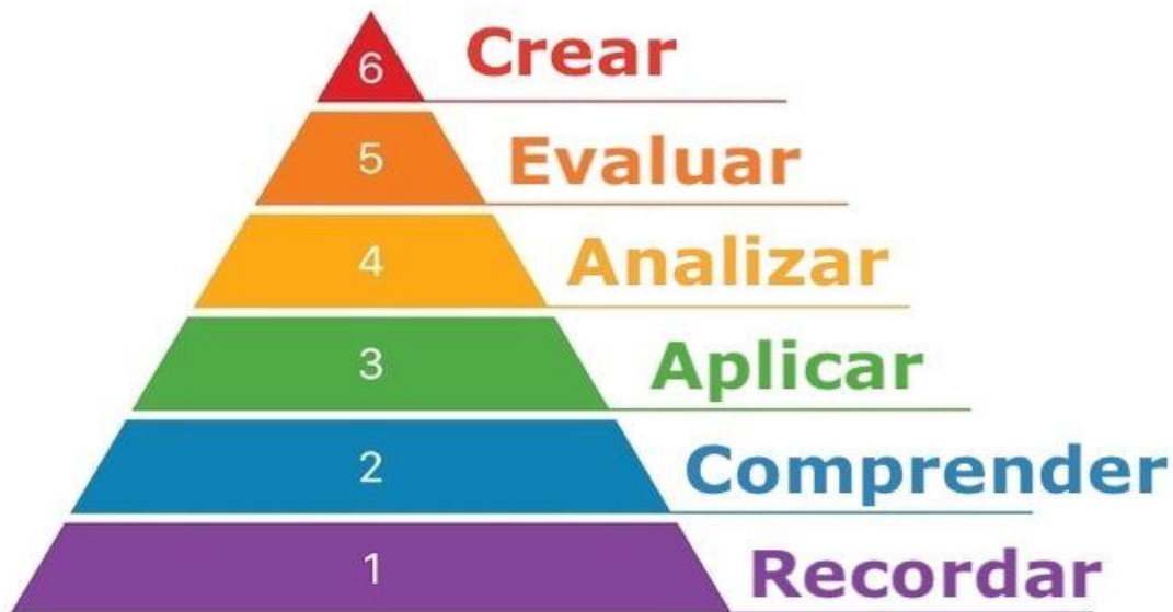
Figura 2. Representación gráfica de la taxonomía de Bloom.