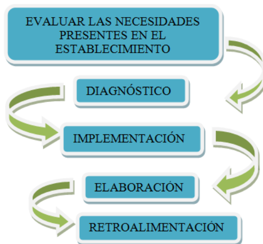
FIGURA 1: Descripción del proceso

El proceso de la sistematización, se llevó a cabo en cinco fases distintas, en las cuales se pretendían alcanzar unos objetivos que fueron delimitados al iniciar la experiencia. La primera fase consistió en evaluar las necesidades presentes en el establecimiento por medio de diarios de campo, grupos focales y entrevistas semiestructuradas. La segunda fase se enfocó en determinar el diagnóstico, el cual dio pie para la revisión teórica acerca de la problemática evidenciada. En la tercera fase de implementación, se delimitaron las temáticas que se incluirían en la guía de atención, con lo cual se diseñó la cartilla. En la cuarta fase se elaboró el contenido y diseño de la cartilla que contiene la guía de atención. Finalmente, en la quinta fase, se realizó el análisis de resultados y las conclusiones de acuerdo a la retroalimentación brindada por dragoneantes e internos mediante una encuesta realizada en la cual brindaron sus observaciones acerca de la guía de atención psicojurídica, para posteriormente dar a conocer la experiencia.