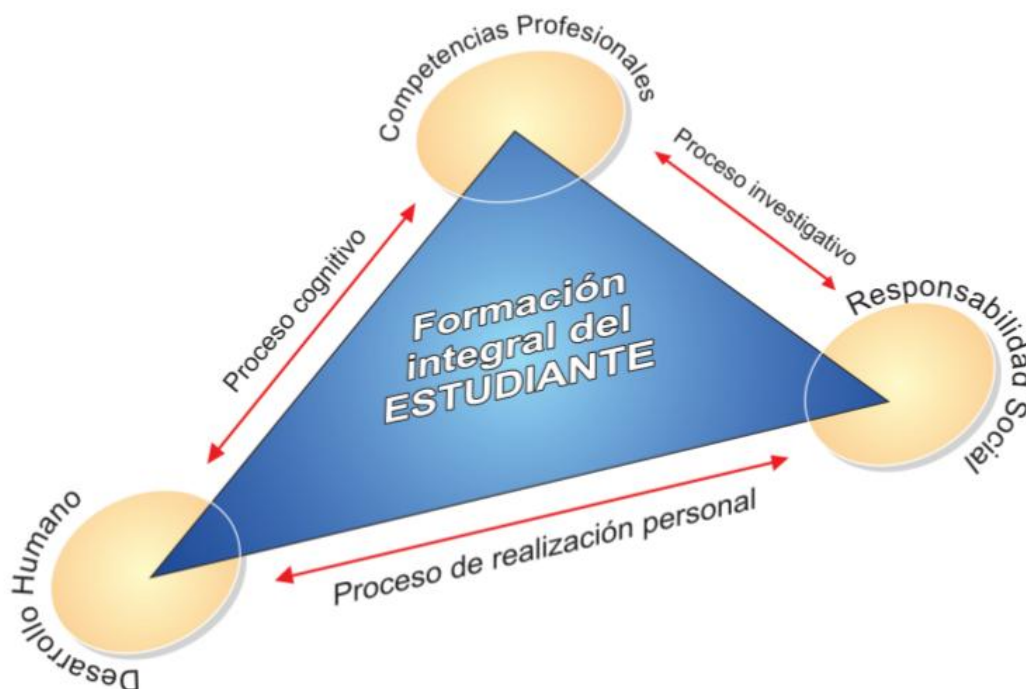
Imagen 1. Sector Bienes de consumo, bienes intermedios, servicios