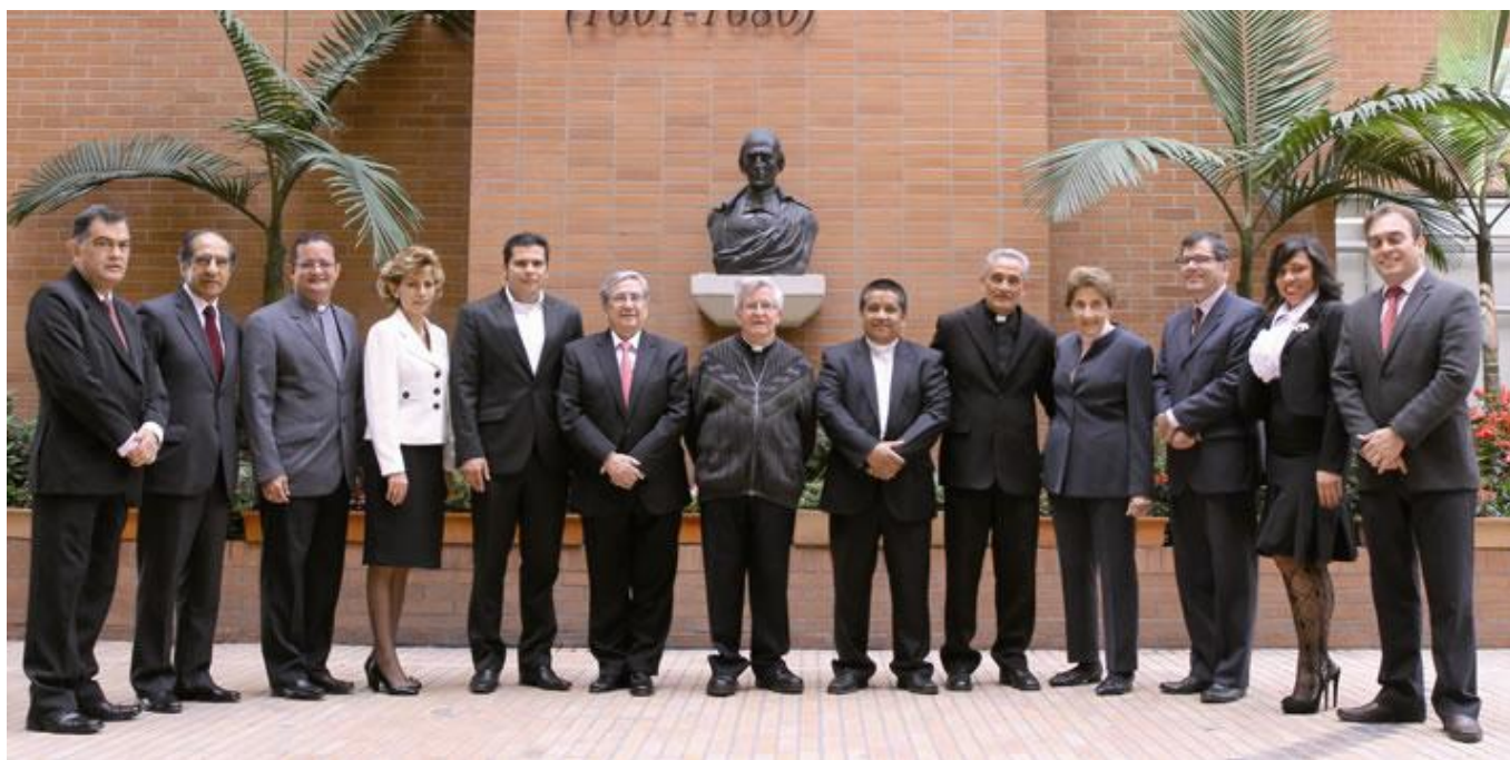
Foto: Líderes del Gobierno Universitario – SISTEMA UNIMINUTO 2014