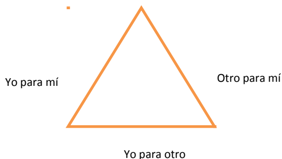
Figura No 1 Triángulo de la triple óptica

Es importante destacar esta filosofía, ya que conlleva a trabajar diferentes manifestaciones estéticas, en donde cada uno sea consciente de la importancia del otro; la actividad estética, como un acto responsable y participativo. Esta triple óptica de Bajtin la podemos graficar de la siguiente forma: