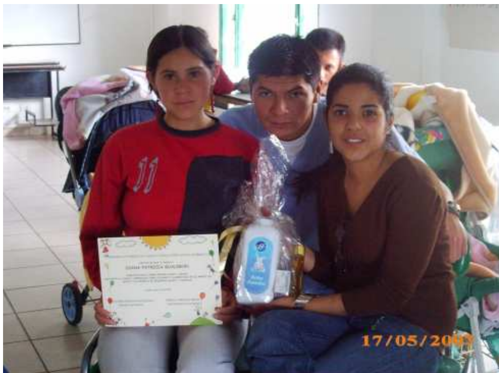
Foto 2: compartiendo con el nutricionista y una de las madres adolescentes.