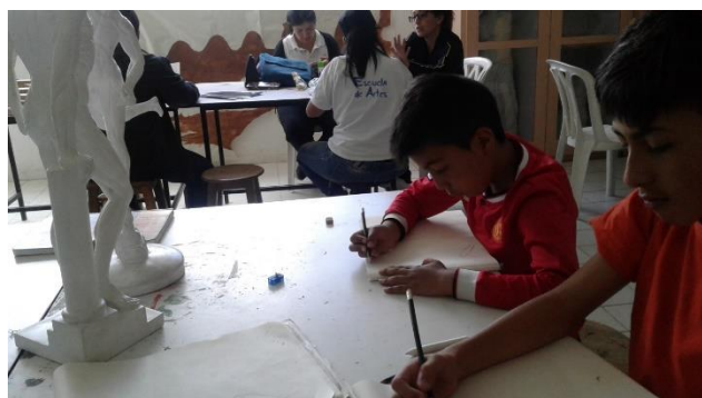
semana 9 Trabaja músculos y detalles de extremidades