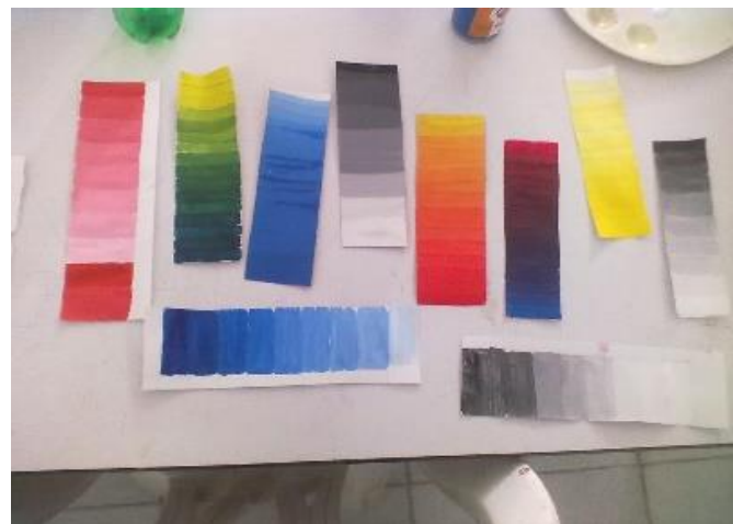
semana 7 Círculo cromático y colores neutros