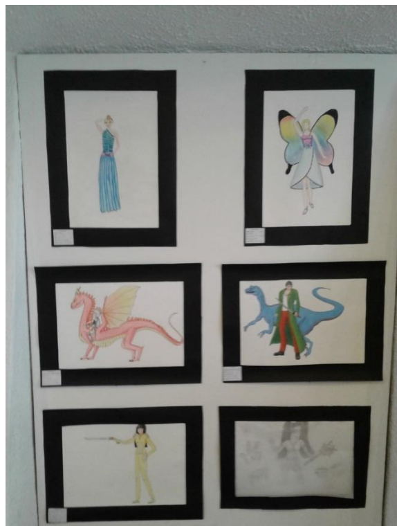
semana 15 Montaje final en el Museo de Arte Contemporáneo UNIMINUTO