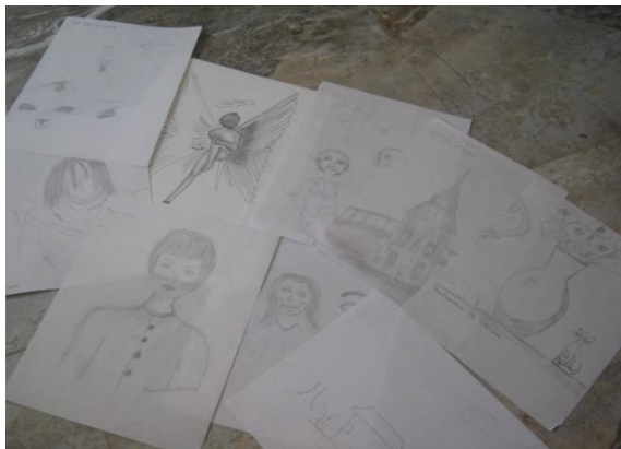
semana 1 Dibujo diagnóstico e introducción al curso