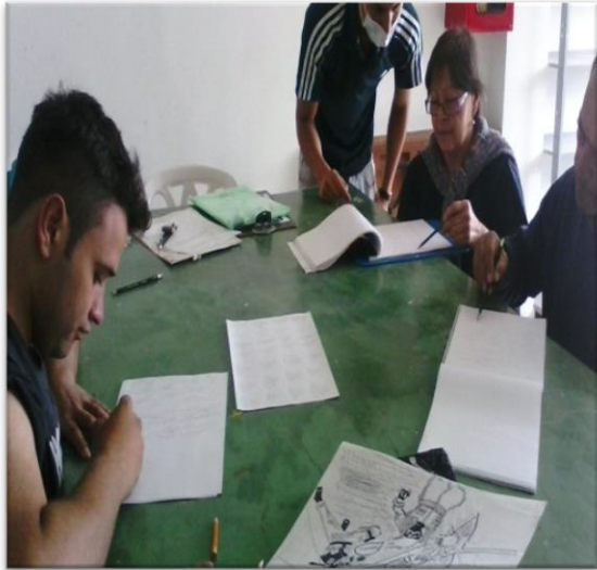
semana 3 Trazo y Tipos de Trazo en grafito