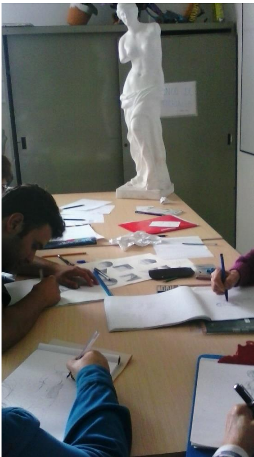
semana 5 Evaluación