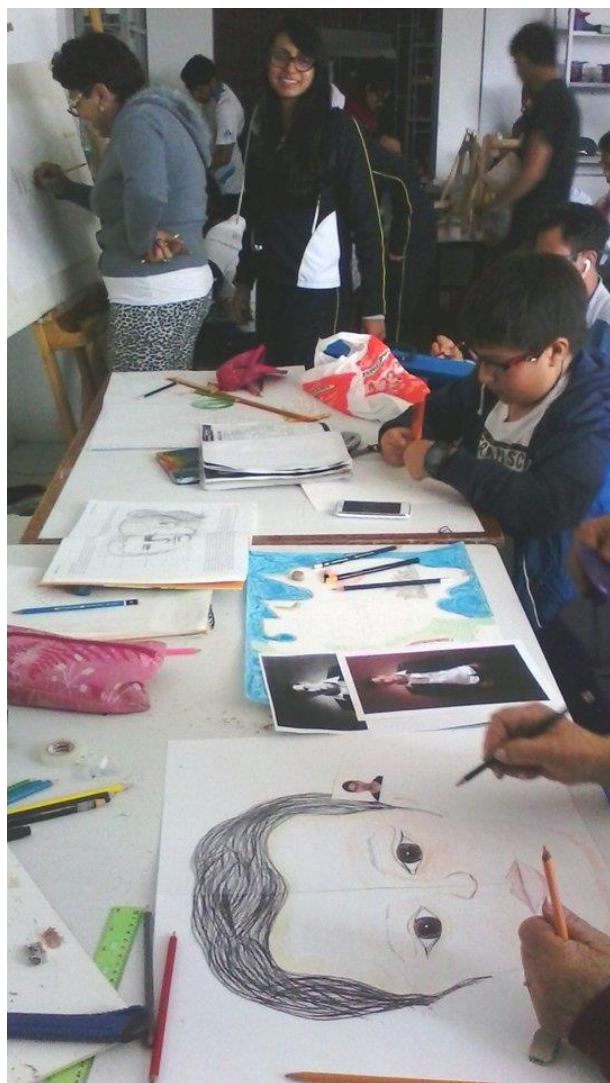
semana 14 Detalles finales de la obra final