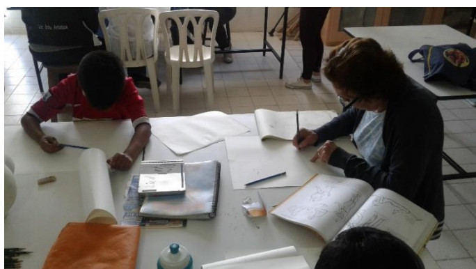
semana 11 creación de boceto trabajo final