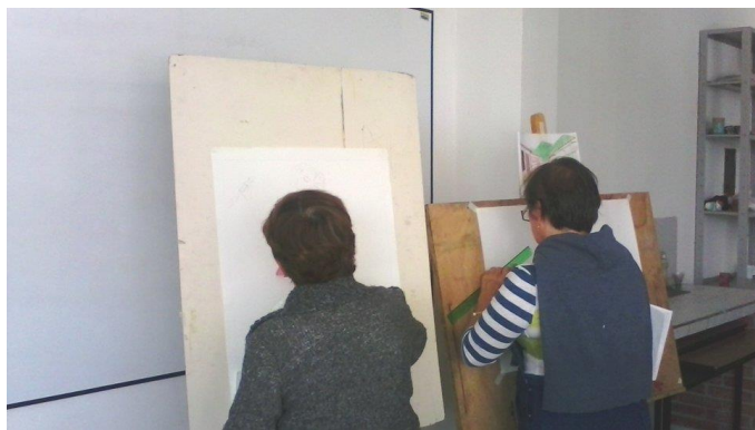
semana 12 Detalle de obra