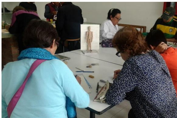
semana 7 Esqueleto humano básico y proporciones