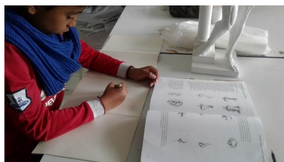
semana 10 Introducción de rostro, proporciones y detalles