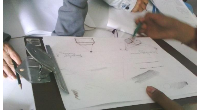
semana 4 Perspectiva y observación