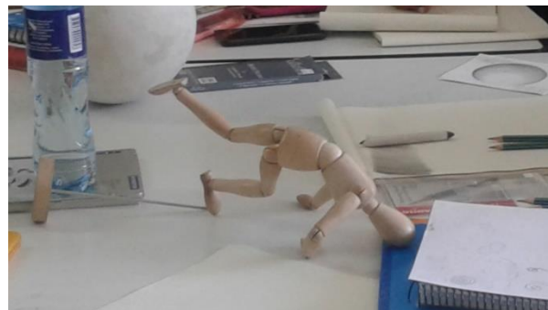
semana 8 Poses de la figura humana