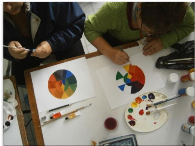
semana 6 Colores en el círculo cromático