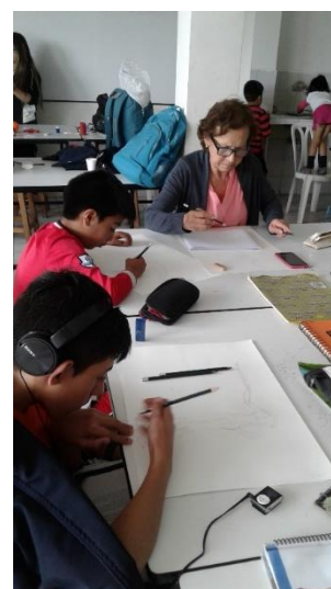
semana 12 Delineado con micro puntas del dibujo final