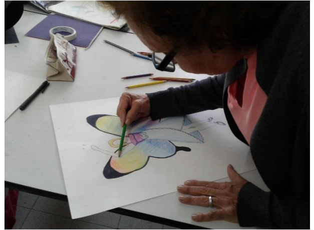
semana 14 Intensificar el color y dar detalles finales