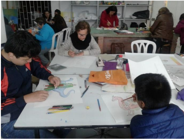
semana 13 Primera capa de color detalles finales