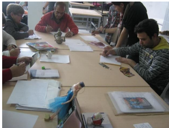
semana 2 Exploración de la memoria emotiva