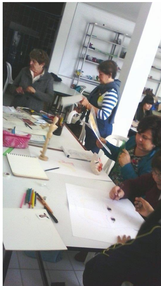
semana 13 Ficha técnica