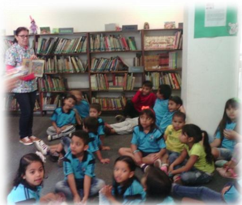
Ilustración 9

Durante mi práctica iniciaba la hora del cuento con los conocimientos previos que tenían los niños, con una serie de preguntas analizaba si contaban con los elementos necesarios para la comprensión del texto o por el contrario tenían conocimientos reducidos, nulos o equivocados, mi papel como docente en muchos casos fue promover la ampliación de conocimientos para aumentar el entendimiento del texto y en otras ocasiones fue generar interrogantes que iban a ser resueltos durante la lectura. Este tipo de conversatorios facilitaba la producción de respuestas