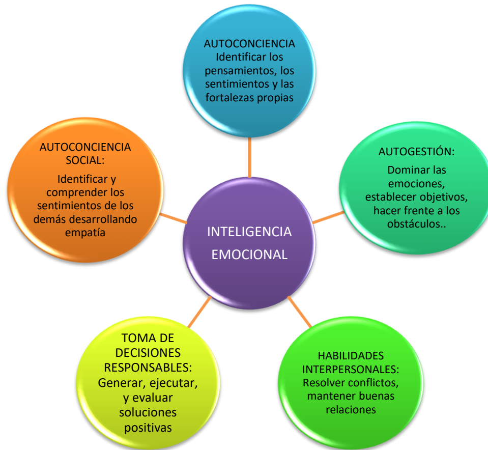
Grafico 2: Clasificación de las emociones según Daniel Goleman