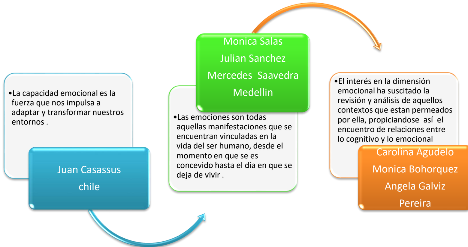
Grafico #3 Estado del arte. Ver anexo