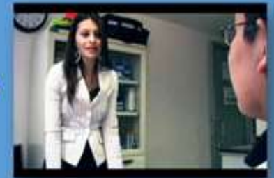
1. Visitador Médico