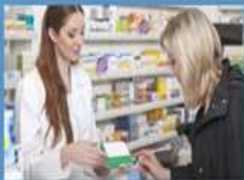
5. Visitador Médico y Farmaceuta