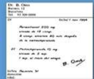
3. Formula (px)