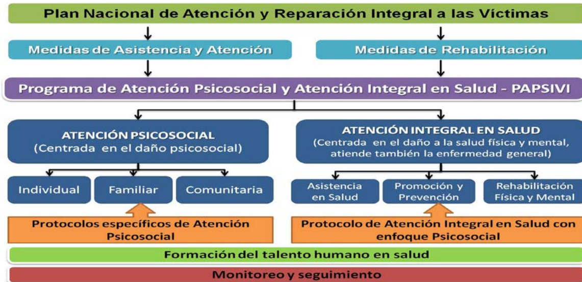
Figura 1. Esquema Programa de Atención Psicosocial y Atención Integral en Salud PAPSIVI.

Con el fin de promover la calidad de la atención a las víctimas e incorporar el enfoque psicosocial, las entidades responsables de la asistencia, atención y reparación deberán capacitar progresivamente al personal encargado en dicha materia de acuerdo a los lineamientos establecidos por el Ministerio de Salud y Protección Social. (Art. 169)