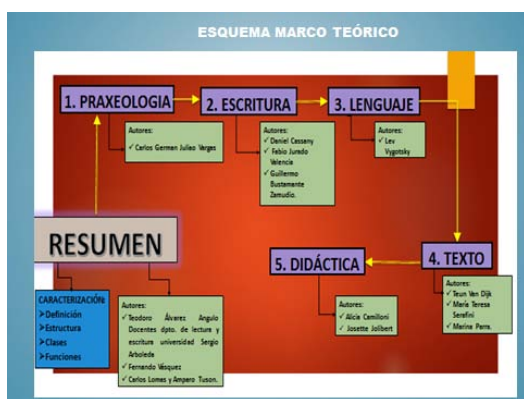
(Esquema del Marco teórico)

Para dar un soporte pedagógico, teórico y didáctico al marco teórico, se estructuró de la siguiente manera, buscando dar un buen sustento que ayudara a fortalecer el trabajo de investigación que se estaba llevando a cabo: