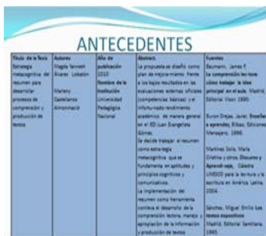
(Cuadro de antecedentes en el proceso de investigación)

Ya para conseguir información que fortaleciera los hallazgos, se visitaron varias universidades, como: La fundación Universitaria Monserrate, Universidad Distrital Francisco José de Caldas, Universidad Santo Tomás, Universidad Pedagógica, Universidad Javeriana y bibliotecas para recopilar información que pudiera servir de apoyo para el proceso que se estaba realizando; en las cuales se indagó sobre la información que allí reposada sobre el tema en cuestión, en este caso, El Resumen.